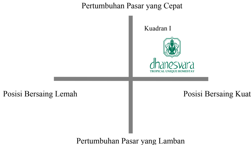
Gambar 2. Matriks Strategi Besar Dhanesvara

Berdasarkan gambar matriks grand strategy di atas peneliti mendapati bahwa Homestay Dhanesvara masuk pada kategori kuadran I melihat industri ini memiliki pertumbuhan pasar yang cepat dan dilihat dari posisi bersaing perusahaan sangat kuat. Maka strategi tepat untuk digunakan oleh perusahaan adalah dengan melakukan pengembangan pasar, dengan meningkatkan kegiatan promosi akan kualitas pelayanan dan fasilitas yang ada sehingga mampu mempertahankan pelanggan lama dan mendatangkan pelanggan baru.