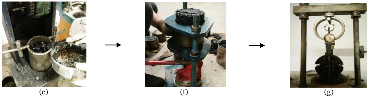
Gambar 1. Tahapan Pembuatan benda uji

(a) Pemotongan serat ijuk; (b) Menimbang agregat; (c) Campuran aspal dan serat ijuk; (d) Campuran yang sudah merata; (e) Menumbuk campuran; (f) Mendongkrak sampel; (g) Pengujian Marshall