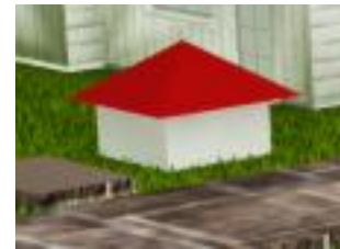
Gambar 3. Fitur Kotak Penjualan

Karakter dapat memasukkan hasil dari perkebunan, ke dalam kotak penjualan yang terletak pada area perkebunan. Karakter tidak dapat mengeluarkan barang dari kotak penjualan. Tidak ada batas jumlah barang yang dapat dimasukkan di kotak penjualan. Setiap pagi pukul 06.00, penjaga penginapan Ravareth akan mengambil barang yang dijual dan memberikan uang setara dengan harga jual barang tersebut secara otomatis. Fitur kotak penjualan dapat dilihat pada Gambar 3.