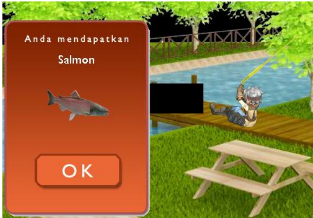
Gambar 1. Fitur Memancing

Karakter dapat memancing di area pancing. Ikan yang ditangkap dapat diberikan kepada NPC untuk mempererat relasi, ataupun dapat dijual di kotak penjualan. Jenis ikan yang dapat ditangkap adalah lele, salmon, ikan mas dan ikan asin. Karakter juga dapat mendapatkan batu kali. Memancing memakan waktu beberapa detik dan karakter tidak mendapatkan ikan secara langsung seperti pada fitur menambang. Area pancing dapat ditemukan di sebelah barat laut perkebunan. Karakter juga memiliki peluang 30% untuk tidak mendapatkan apa-apa. Fitur memancing dapat dilihat pada Gambar 1.