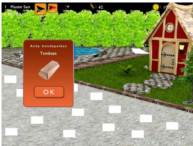
Gambar 2. Fitur Menambang

Karakter dapat menambang pada area pertambangan. Batu yang didapatkan dapat dibawa kepada pandai besi untuk dijadikan perhiasan, diberikan sebagai hadiah pada NPC, ataupun dijual di kotak penjualan. Jenis batu yang dapat didapatkan adalah batu kali, tembaga, perak dan emas. Karakter juga bisa tidak mendapatkan apapun pada saat menambang. Karakter juga memiliki peluang 40% untuk tidak mendapatkan apa-apa. Fitur menambang dapat dilihat pada Gambar 2.