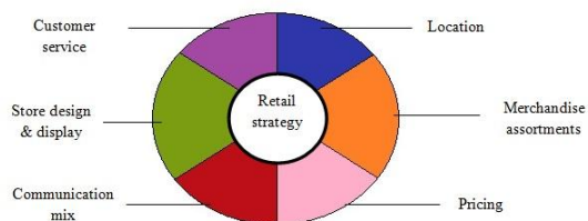
Gambar 1. Elemen di Dalam Retail Mix

Menurut Levy & Weitz (2009, p.21) element dalam retail