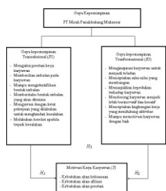
Gambar 2.1. Kerangka konseptual

Sumber: Koech dan Namusonge 2012; Z. A. Khan, Nawaz, dan I. Khan 2016; Yulk 2013; Avolio 2011; dan Royle dan Hall 2012