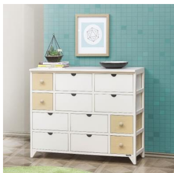
Gambar 3. Produk akhir “Sandra 12 drawer”