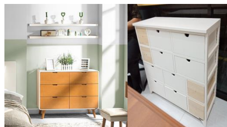
Gambar 2. Produk sebelum inovasi dan prototype laci

Inovasi produk yang dilakukan oleh PT Karyayudha Tiaratama berfokus pada pengembangan dan duplikasi dimana produk baru yang akan di buat merupakan hasil akhir dari pengembangan produk yang di buat berdasarkan keinginan konsumen. Contoh inovasi produk yang akan dibahas seperti terlihat pada Gambar 2 produk sebelum inovasi dan produk prototype setelah inovasi dan Gambar 3 produk hasil akhir yang siap dijual ke konsumen.