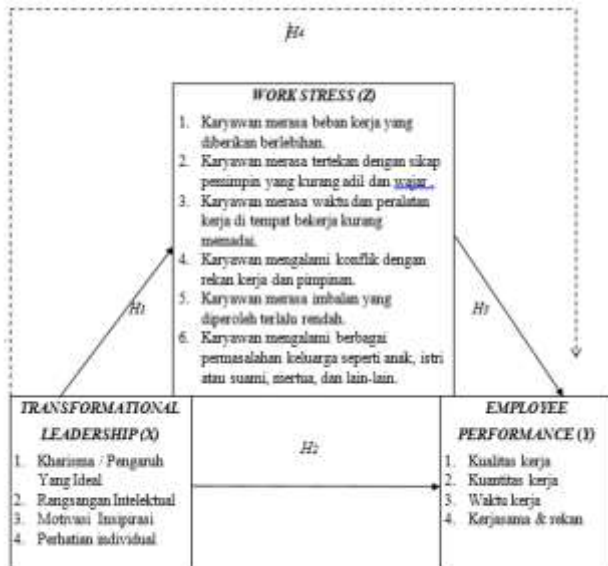
Gambar 2.5 Kerangka Penelitian