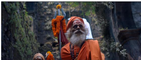
Gambar 1. Tokoh Sadhu yang mewakili masyarakat India

Dalam video klip Coldplay ini terdapat beberapa karakter-karakter orang India yang digambarkan. Video klip yang berlatar lingkungan negara India ini mencoba menggambarkan kehidupan masyarakatnya.