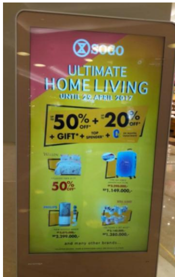
Gambar 2. Tampilan Diskon dan Harga

Gambar diatas menggambarkan iklan pada media promosi LED Signage dengan jawaban tertinggi yang menyebabkan 84% responden memiliki niat untuk melakukan pembelian produk. Sehingga pada akhirnya, terdapat 74% responden dari 84% responden pada tahap intentions menjawab satu brand dengan jumlah tertinggi pada tahap action ini. Responden menjawab iklan Sogo yang dipilih responden pada akhirnya saat memutuskan untuk mengambil tindakan yaitu berbelanja atau melakukan transaksi di tempat. Dari hal tersebut, maka dapat disimpulkan bahwa iklan Sogo yang menjadi tolak ukur dan standar dari keberhasilan efektivitas media promosi LED Signage . Hal ini disebabkan karena iklan yang ditampilkan pada media memenuhi kriteria iklan yang sebenarnya menurut jawaban dari 100 responden pada penelitian ini.