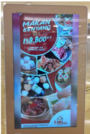
Gambar 1. Penggambaran Karakteristik Poster

Alasan pertama yang menjadi dasar mengapa media ini efektif adalah media ini memenuhi kriteria iklan poster dengan ukuran yang besar. Pada umumnya ukuran poster cukup besar, sehingga poster dapat mendominasi pandangan dan menarik perhatian (Jefkins, 1996, p.128-129). Pada tahap interest terdapat jawaban tertinggi dengan ukuran yang besar dan warna yang menarik. Hal ini menyebabkan 80% responden tertarik ( interest ) dengan media promosi LED Signage yang dimiliki Pakuwon Mall. Berikut ini adalah gambaran dari ukuran serta warna pada media promosi LED Signage di Pakuwon Mall: