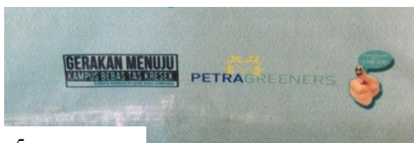
Gambar 5. Pesan Kampanye

Berikut adalah hasil kuesioner yang telah disusun oleh peneliti dan telah dibagikan kepada 100 mahasiswa Universitas Kristen Petra.