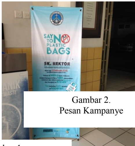
Gambar 2. Pesan Kampanye

Berikut adalah gambar-gambar pesan di dalam x-banner kampanye tersebut.