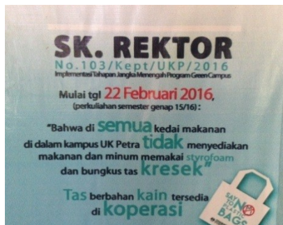
Gambar 3. Pesan Kampanye