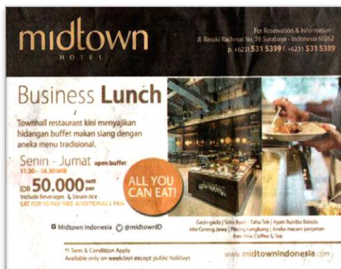
Gambar 1. Iklan Business Lunch Midtown Hotel di Harian Jawa Pos

Belanja iklan terbesar kedua setelah televisi adalah surat kabar, dengan kata lain surat kabar merupakan media untuk beriklan dengan posisi terpenting kedua setelah televisi (Morissan, 2010, p. 301-302). Salah satu industri bisnis yang menggunakan iklan di media surat kabar untuk mempromosikan produknya adalah hospitality industry . Hospitality industry adalah industri yang bergerak di bidang pelayanan jasa dan akomodasi. Bisnis perhotelan merupakan wujud dari hospitality industry yang bergerak di bidang pelayanan jasa (Minarni, 2004, par. 6). Dalam penelitian ini akan difokuskan pada iklan Midtown Hotel Surabaya mengenai promo terbarunya Business Lunch yang dimuat di harian Jawa Pos.