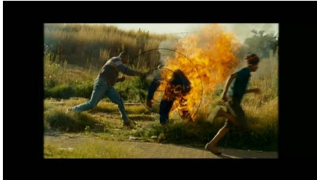
Gambar 2. Foto karya Greg yang mendapatkan penghargaan pulitzer

Greg dalam mencari berita di dekat stasiun Inhlazane, ia meliput sebuah penganiayaan yang dilakukan oleh beberapa pendukung ANC kepada salah satu pendukung Inkatha yang dalam film ini diceritakan menggunakan baju biru. Penganiayaan berawal dengan memukul, menendang dan menusuk korban, ia mencoba untuk menghentikan pembunuhan dengan berdialog, namun penganiayaan tetap berlanjut. Setelah itu pelaku penganiayaan membakar hidup-hidup pria berbaju biru ini dan menebaskan pisau besar dikepala korban.