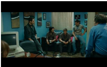
Gambar 3. Terjadi perdebatan untuk memutuskan keberpihakan media

Diceritakan perdebatan antara Ronald sebagai Editor koran “The Star”, Robin sebagai redaktur foto beserta keempat wartawan foto. Berawal ketika Greg meliput penganiayaan pria berbaju biru di dekat Stasiun Inhlazane yang diceritakan dalam scene 15. Greg mengabadikan momen ketika seorang penganiaya menebaskan sebuah pisau besar tepat dikepala korban, yaitu pria berbaju biru yang pada saat itu ia telah dibakar hidup-hidup (gambar 4.40). Setelah foto karya Greg tentang Pria berbaju Biru yang dijual ke AP ( Associate Press ), foto tersebut laku terjual di berbagai media massa berbagai negara. Setelah beredarnya foto tersebut, pihak polisi setempat mendatangi kantor “The Star” mencari Greg dan memintanya untuk bersaksi atas pembunuhan. Mereka berdebat dalam mengambil keputusan apa yang terbaik, untuk tidak memihak kepada polisi