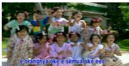
Gambar 2. Pesan moral prososial memuji dalam video klip “Semua Oke”

Indikator yang diambil untuk analisa adalah dari jumlah keseluruhan porsentase diatas 5%. Jika jumlah porsentase dibawah 5% maka tidak masuk dalam analisa.