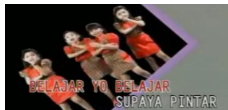
Gambar 3. Pesan moral prososial menasehati dalam video klip “Semua Pintar”