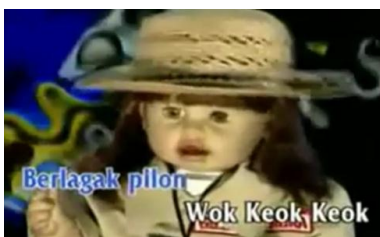
Gambar 4. Pesan moral antisosial mengejek dalam video klip “Di maem”

Indikator yang diambil untuk analisa adalah dari jumlah keseluruhan persentase diatas 5%. Jika jumlah persentase dibawah 5% maka tidak masuk dalam analisa.