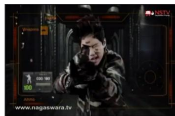
Gambar 5. Pesan moral antisosial memegang senjata dalam video klip “ASBOYS”

Munculnya video klip lagu anak-anak Indonesia pada tahun 1990-1999 bersamaan dengan kondisi keadaan Indonesia yang mana pada jaman orde baru semua tindak tanduk yang dilakukan oleh pers dan media massa semua diatur oleh pemerintah. Sesuai dengan peraturan perundang-undangan SIUPP (Surat Ijin Usaha Perusahaan Pers) seperti yang tertulis dalam pasal 13 ayat 5. Belum adanya kebebasan pers maka, pers dan pekerja seni pada jaman orde baru tidak berani untuk mengeksplorasi ide, gagasan yang berlebihan apalagi mengkritik pemerintah Indonesia. Setiap hasil karya yang dihasilkan harus mendapatkan SIUPP dan pengawasan dari pemerintah. Pada jaman itu jarang pers dan pekerja seni yang berani membuat karya yang menjatuhkan pemerintah pada saat itu. Jika hal itu terjadi maka akan segera dilakukan pembredelan dan ijin SIUPP akan dicabut. Oleh karena itu video klip lagu anak-anak Indonesia tahun 1990-1999 pesan moral prososial yang ingin disampaikan adalah memuji. Banyaknya pesan moral prososial mendidkan juga di dukung oleh munculnya stasiun televisi pendidikan Inonesia (TPI). Serta adanya instruksi presiden nomor 1 tahun 1994 mengenai pelaksanaan wajib belajar pendidikan dasar dan dalam rangkan pemberantasan buta aksara. Tahun 2000-2013 video klip lagu anak-anak Indonesia banyak bermunculan dipelopori film “Petualangan Sherina”. Serta akhir tahun 2012-2013 banyak lagi bermunculan penyanyi cilik dengan mengusung boy and girl band cilik.