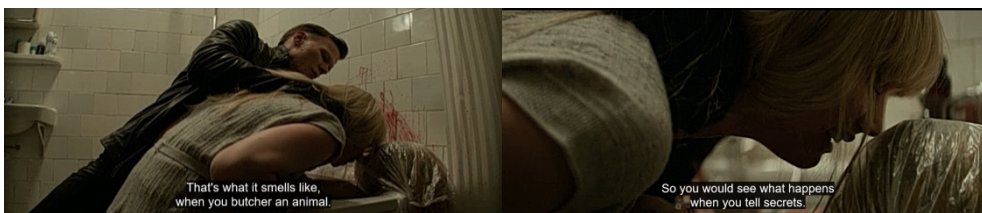
Gambar 9. Matorin memaksa Dominika mencium bau mayat Marta

Melalui level representasi kamera, pengambilan gambar dengan medium close up yang diambil dari low-angle menunjukkan dominasi Matorin terhadap Dominika. Selain itu juga memperjelas aksi Matorin terhadap Dominika, memegang leher Dominika dan menundukkannya sampai menyentuh mayat Marta. Ekspresi ketakutan Dominika begitu terlihat dengan pengambilan gambar close up dan suara isakan tangis Dominika. Matorin juga mengancam Dominika, tidak hanya mengancam tetapi menyamakan Marta dengan hewan.