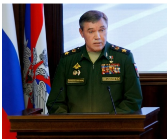
Gambar 4. Verasi Gerasimov

Seragam yang dipakai Jenderal Korchnoi tersebut mirip dengan seragam yang digunakan oleh Verasi Gerasimov, kepala staf umum militer Rusia. Jadi dapat dikatakan bila Jenderal Korchnoi memiliki kedudukan yang cukup tinggi dalam bidang militer.