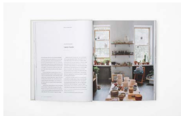
Gambar 1. Contoh Layout Simplicity