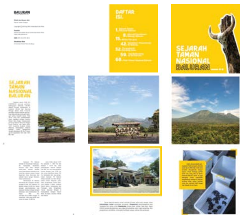
Gambar 2. Layout Book Final Chapter 1