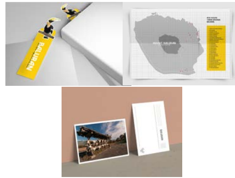
Gambar 4. Final Artwork Media Pendukung