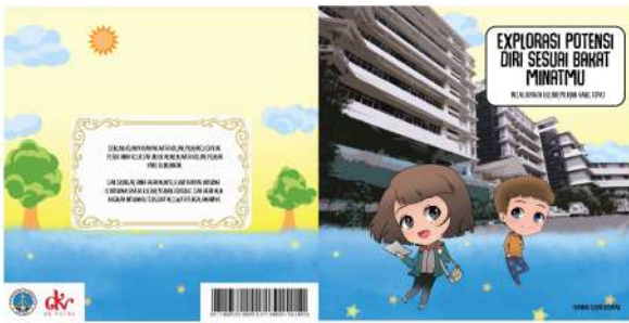
Gambar 17. Cover buku