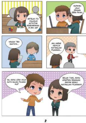
Gambar 11. Intro 2