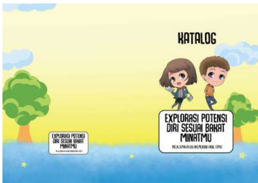
Gambar 24. Cover katalog