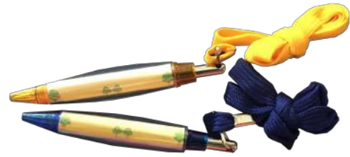
Gambar 20. Desain bolpen