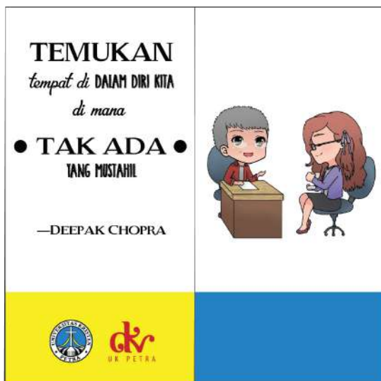
Gambar 19. Bookmark buku 2