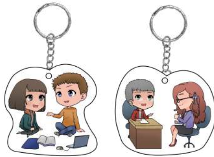
Gambar 23. Desain gantungan kunci