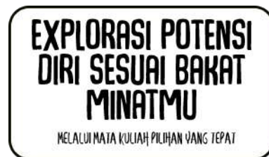
Gambar 5. Judul buku beserta tipografi