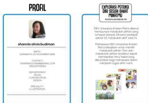
Gambar 25. Isi katalog 1