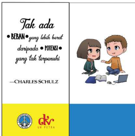
Gambar 18. Bookmark buku 1