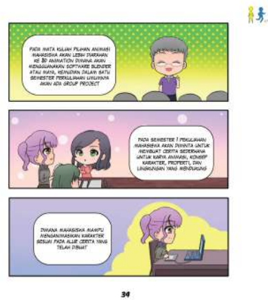
Gambar 15. Isi 2