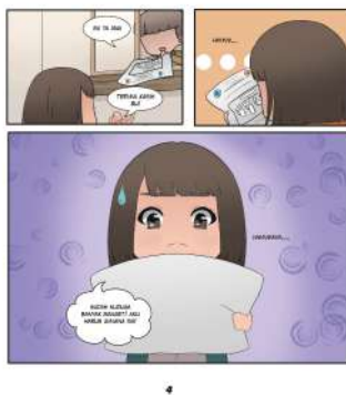
Gambar 13. Intro 4