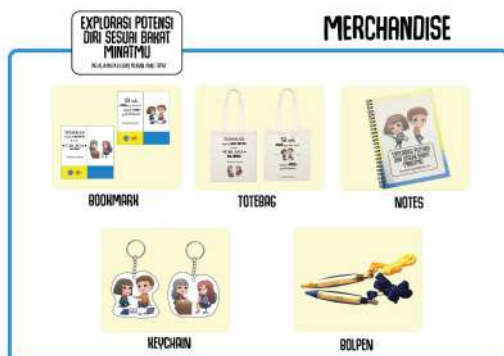
Gambar 26. Isi katalog 2