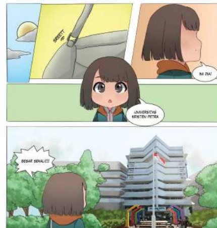
Gambar 10. Intro 1