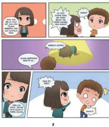
Gambar 12. Intro 3