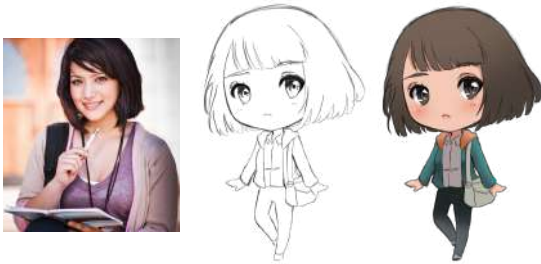
Gambar 6. Karakter Anna