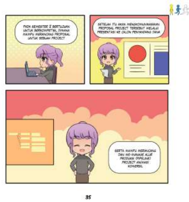
Gambar 14. isi 1