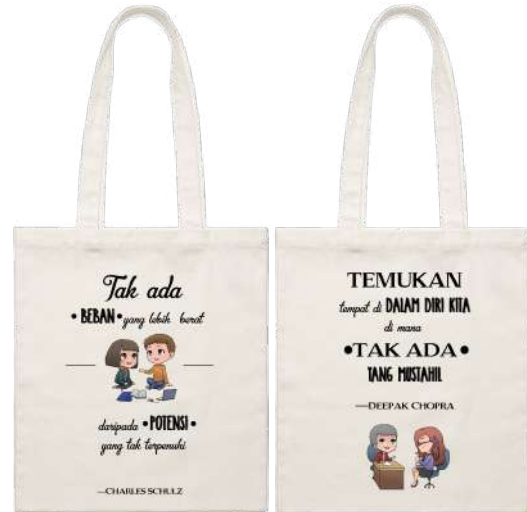
Gambar 21. Desain totebag