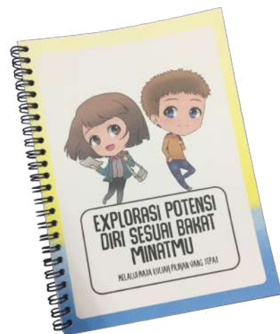
Gambar 22. Desain notes