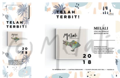
Gambar 5. X-Banner & Poster Promosi