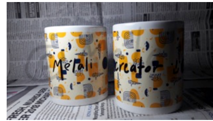
Gambar 7. Media Pendukung