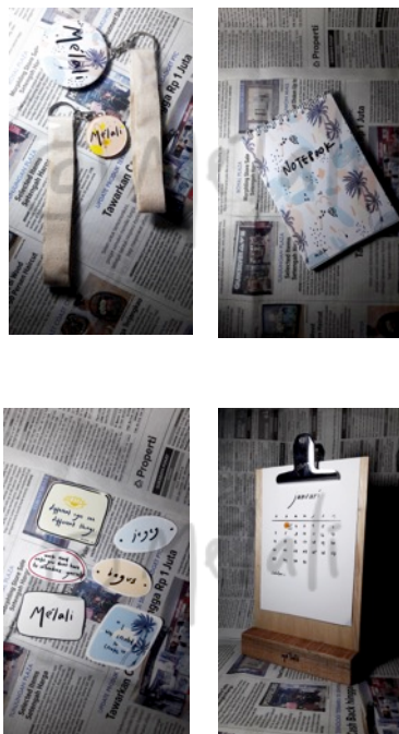
Gambar 6. Media Pendukung