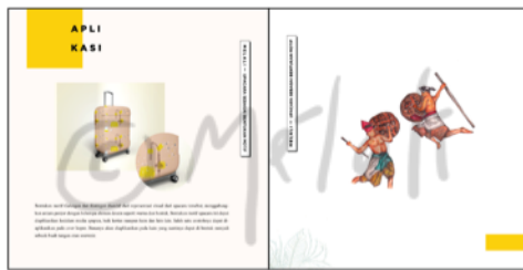
Gambar 4. Isi Buku Motif