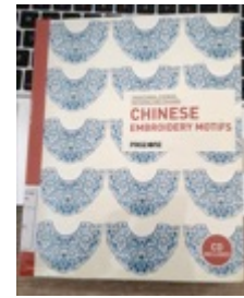
Gambar 1. Buku Motif

Dilihat dari segi fungsi bukunya memiliki banyak keunggulan yaitu sifatnya yang praktis, mudah dibawa kemana-mana, dapat dibaca ulang dimanapun dan kapanpun selain itu juga dapat disimpan dalam jangka waktu yang panjang.