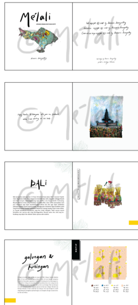
Gambar 3. Isi Buku Motif

Setelah melalui beberapa pertimbangan dengan isi buku dengan jumlah halaman 95 halaman dengan warna full color dan beberapa merchandise seperti calendar , gantungan kunci dan pembatas buku yang diberikan pada