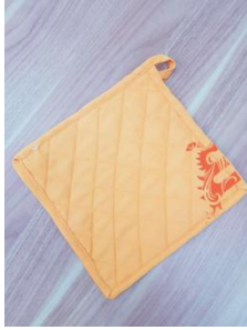
Gambar 10. Kain penahan panas (jampel)