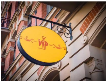
Gambar 14. Ciri-ciri untuk diamati