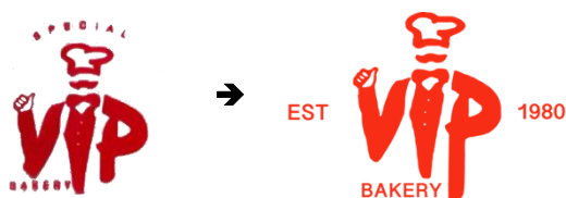
Gambar 4. Perubahan logo lama menjadi baru

Bentuk dasar yang dipakai pada logogram berasal dari logo lama yang kemudian di re-branding logonya dengan merapikan gesture baker di dalam logo, menghilangkan 'SPECIAL', menambahkan 'EST', '1980', dan menyesuaikan letak 'BAKERY'. Hal ini ditujukan agar perubahan logo yang baru tidak membingungkan masyarakat dan menjelaskan bahwa perusahaan ini adalah perusahaan Bakery yang telah berdiri semenjak tahun 1980.