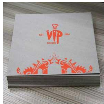
Gambar 19. Kertass roti