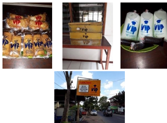
Gambar 1. Produk dan Lokasi VIP Bakery

Masuknya pesaing global seperti Holland Bakery, Roti'O, dan Mokko factory di Tulungagung menjadi salah satu faktor penyebab utama penurunan pangsa pasar VIP Bakery. Para pesaing global ini dapat menarik perhatian ketika mereka baru masuk ke dalam lingkup masyarakat Tulungagung. Mereka dapat memunculkan image yang positif sehingga membuat konsumen percaya dan nyaman akan produk dan pelayanan mereka. Hal ini dikarenakan mereka memiliki corporate identity yang baik dan jelas. Corporate identity merupakan identitas visual suatu perusahaan dalam mempresentasikan nama, karakter, sifat, visi, dan misi dari perusahaan. Tujuan dari dibuatnya corporate identity adalah untuk membuat image / citra perusahaan terlihat baik dimata konsumen, sehingga memungkinkan perusahaan untuk dikenal. Corporate identity sendiri bisa berupa logo, stationery , seragam perusahaan, iklan, publikasi, dan lain sebagainya. Identitas perusahaan disebut juga sebagai simbol perusahaan, apakah berbentuk logo perusahaan atau lambang lainnya (Kasali,2003). Namun VIP Bakery sendiri tidak memiliki corporate identity yang baik dan jelas seperti para pesaingnya (seperti pada gambar 1.1). Hal ini menyebabkan VIP Bakery tidak bisa menyampaikan citra perusahaan yang baik kepada konsumen.