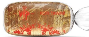
Gambar 17. Mockup pembatas buku