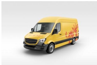
Gambar 12. Mobil perusahaan