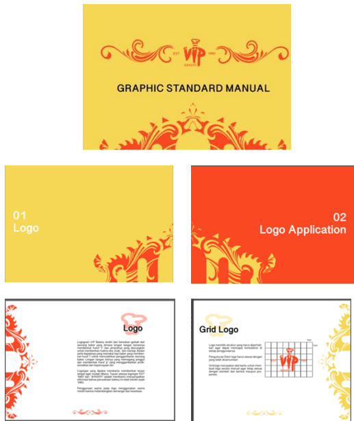
Gambar 20. Buku GSM