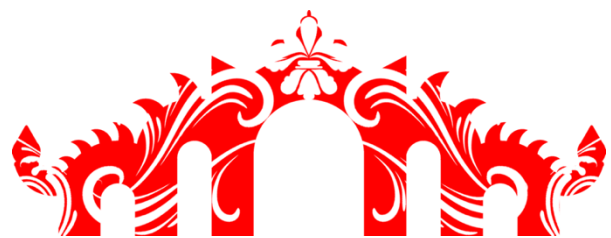
Gambar 8. Final artwork gapura / pintu masuk Candi Dadi