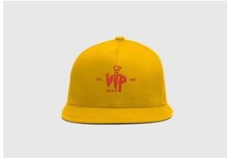
Gambar 11. Topi