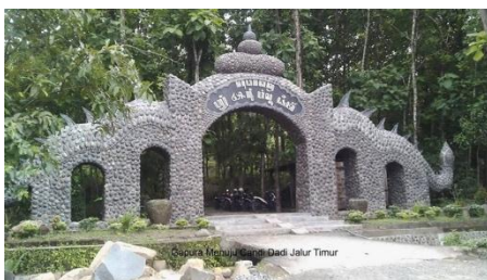
Gambar 3. Gapura Candi Dadi

Gapura / pintu masuk wisata candi Dadi dipilih sebagai unsur yang membantu menciptakan ikonik khas kota Tulungagung terhadap corporate identity VIP bakery. Unsur ini digunakan karena dapat membantu menciptakan identitas VIP bakery toko roti khas dari Tulungagung.