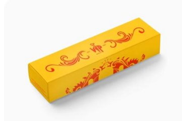
Gambar 15. Box Packaging Lonjong