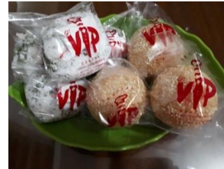
Gambar 2. Aplikasi Logo lama pada Kemasan VIP Bakery

Berikut ini adalah analisis desain dari logo VIP Bakery lama yang diaplikasikan ke dalam kemasan plastik produknya dan akan dilihat dari berbagai aspek yang berbeda. Hal ini dilakukan agar dapat mengetahui kekurangan dan kelebihan yang dimiliki sehingga dapat bermanfaat untuk perancangan corporate identity yang baru.