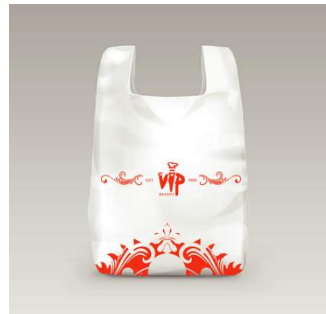
Gambar 18. Plastic bag