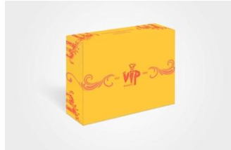
Gambar 16. Box Packaging Persegi