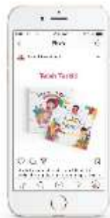
Gambar 20. Akun instagram