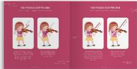
Gambar 11. Halaman isi buku panduan orang tua