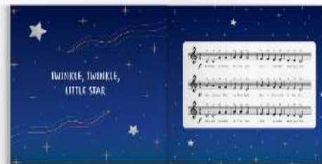
Gambar 16. Halaman isi buku panduan orang tua