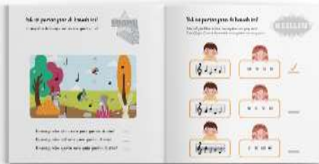
Gambar 17. Halaman isi buku panduan orang tua