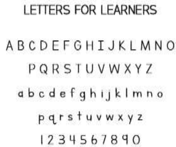
Gambar 4. Font “Letters For Learners”