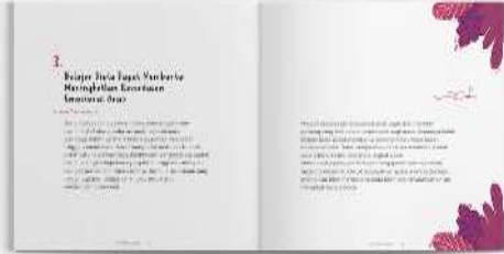
Gambar 9. Halaman isi buku panduan orang tua