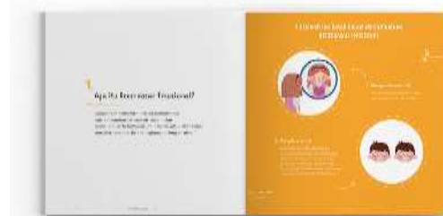
Gambar 8. Halaman isi buku panduan orang tua