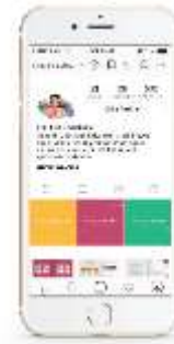
Gambar 21. Akun instagram