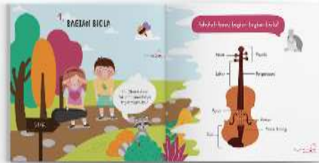
Gambar 14. Halaman isi buku panduan orang tua