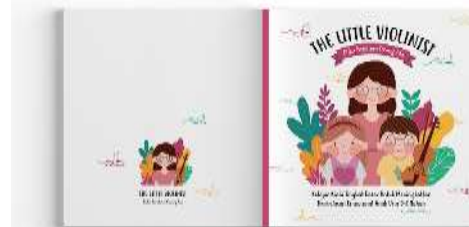
Gambar 7. Cover buku panduan orang tua