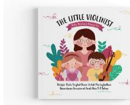
Gambar 6. Cover buku panduan orang tua

Berikut ini adalah hasil final desain buku pembelajaran biola untuk anak usia 5-8 tahun: