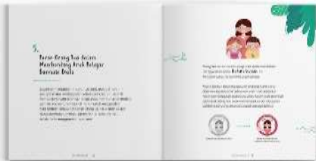
Gambar 10. Halaman isi buku panduan orang tua