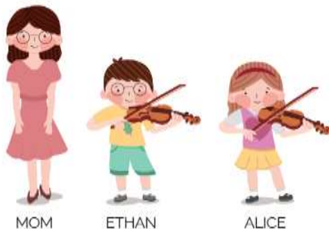
Gambar 5. Karakter

Gaya ilustrasi yang akan digunakan adalah ilustrasi 2D yang menggunakan warna primer, dan menggunakan minim gradient . Pada buku pembelajaran ini akan menggunakan 3 karakter yaitu Mom, Ethan, dan Alice. Karakter Mom digambarkan sebagai sosok Ibu yang lemah lembut, dan juga berperan sebagai guru biola. Karakter Ethan digambarkan seperti anak laki-laki yang pintar dan rajin belajar, berperan sebagai teman belajar biola anak. Karakter Alice digambarkan seperti anak perempuan yang rajin dan gemar bermain biola, berperan sebagai teman belajar biola anak.