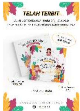
Gambar 19. Poster promosi