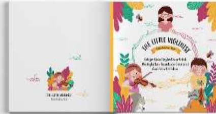
Gambar 13. Cover buku panduan anak