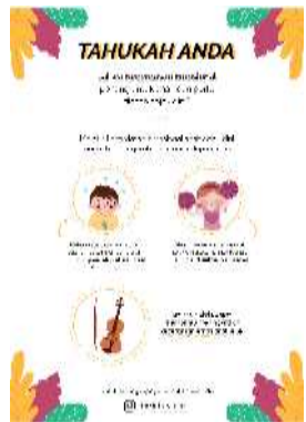
Gambar 18. Poster promosi