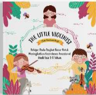
Gambar 12. Cover buku panduan anak