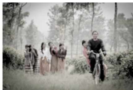
Gambar 10. Mandor Bersepeda