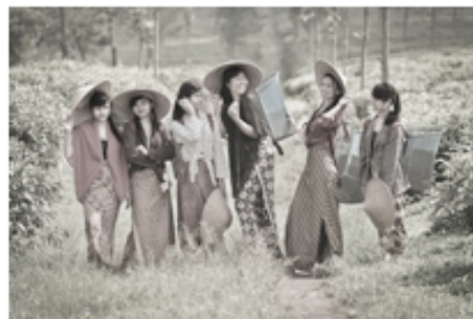
Gambar 6. Kegembiraan Pemetik Teh