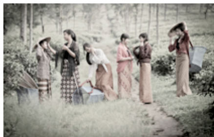
Gambar 3. Persiapan Memetik