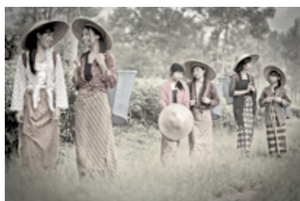
Gambar 5. Para Pemetik Teh