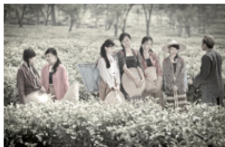
Gambar 4. Pembagian Tugas