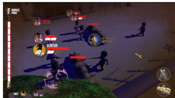
Gambar 6. Gameplay Screenshot