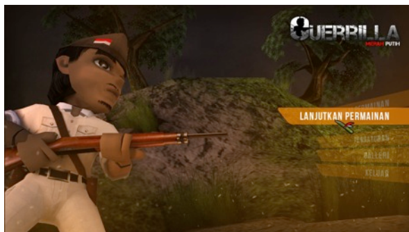
Gambar 2. Menu Screen