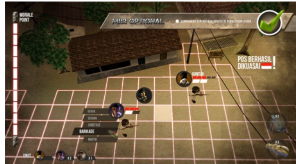
Gambar 5. Gameplay Screenshot