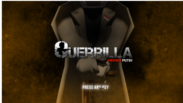
Gambar 1. Start Screen

Setelah proses perancangan selesai, gameplay , desain layout interface, dan video ilustrasi ditampilkan dalam satu kesatuan aplikasi komputer.