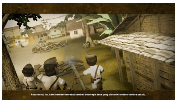
Gambar 3. Video Screenshot