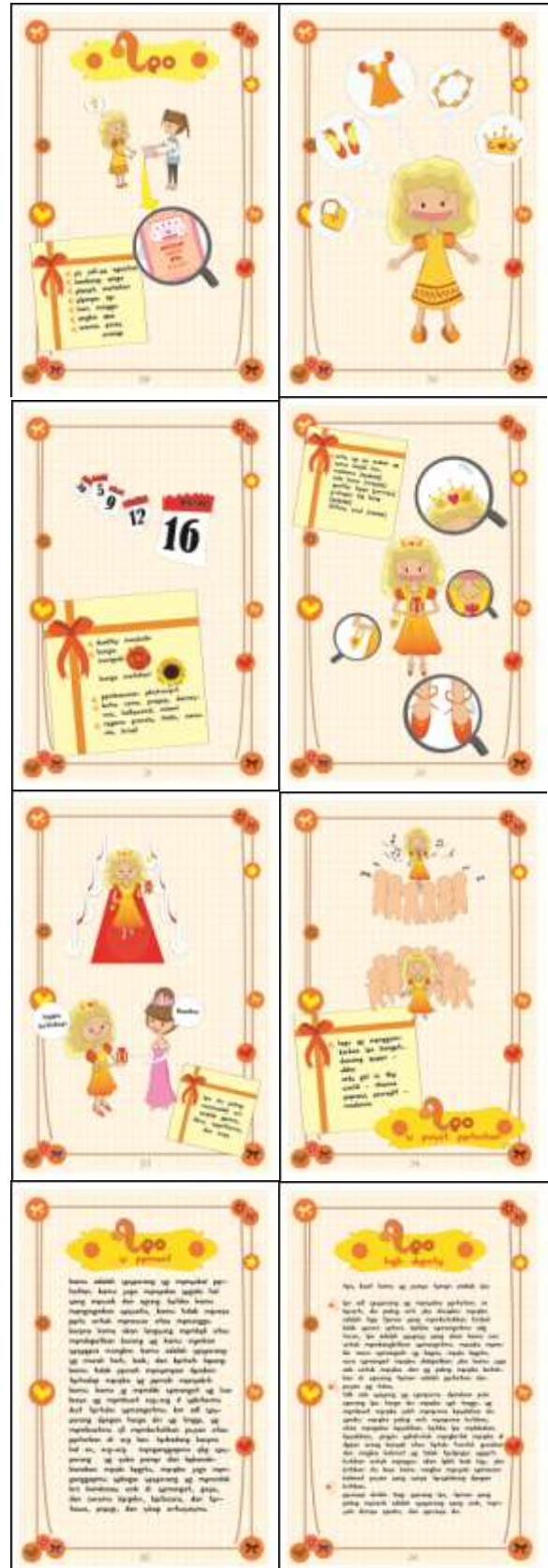
Gambar 9. Leo