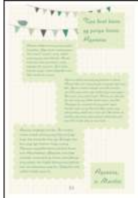
Gambar 15. Aquarius