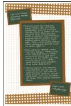
Gambar 14. Capricorn