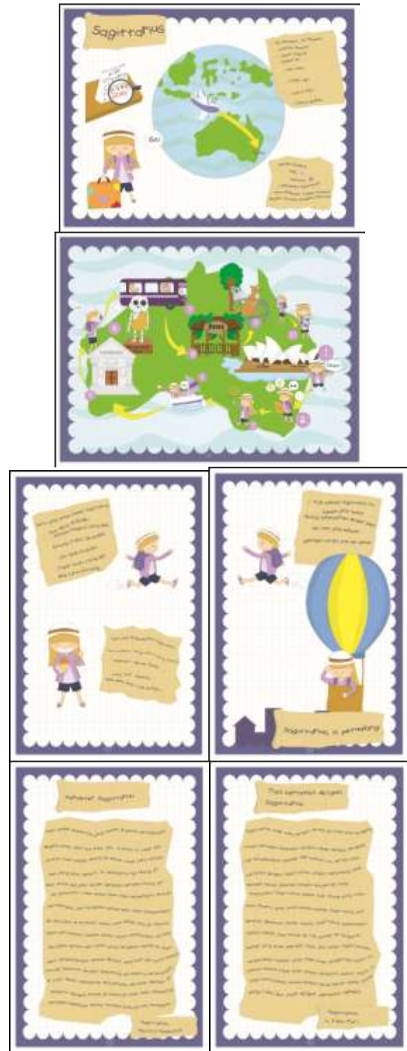
Gambar 13. Sagittarius