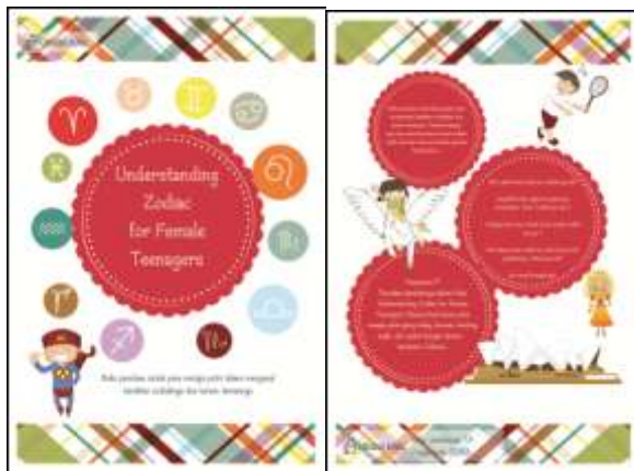
Gambar 4. Cover Buku Understanding Zodiac for Female Teenagers

Perancangan buku ilustrasi ini akan menggunakan percampuran berbagai macam gaya grafis seperti Art and Craft pada layout zodiak Leo dan Aquarius, New Simplicity untuk layout zodiak Taurus, Gemini, Cancer, Capricorn yang memiliki banyak white space , dan Plakatstil untuk pewarnaan latar belakang semua zodiak yang hanya didominasi oleh satu warna. Pemilihan warna yang akan digunakan menyesuaikan dengan karakter dari masing-masing zodiak yang akan dibahas. Teknik gambar yang dilakukan adalah penggabungan teknik manual (pensil) dengan digital (komputer). Buku ilustrasi ini dicetak dengan teknik cetak offset . Penjilidan dengan soft cover untuk memudahkan para pembaca dalam membaca. Jenis kertas yang akan digunakan adalah kertas art paper 150 gr yang tidak terlalu tebal.