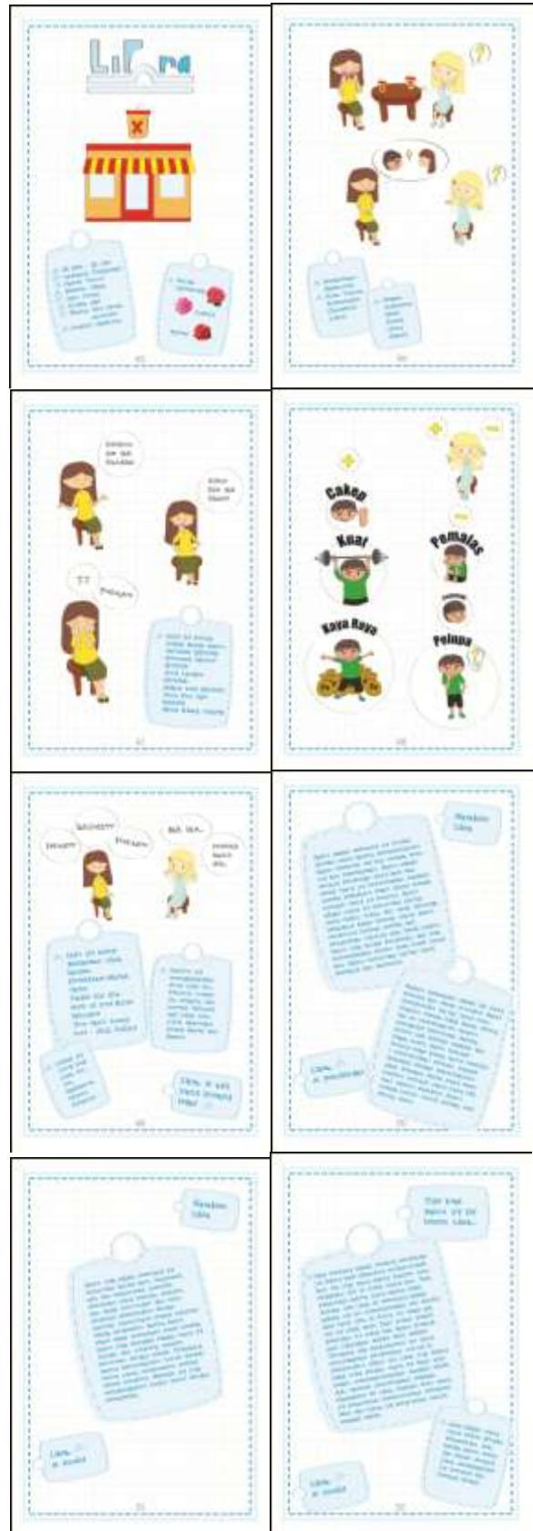
Gambar 11. Libra