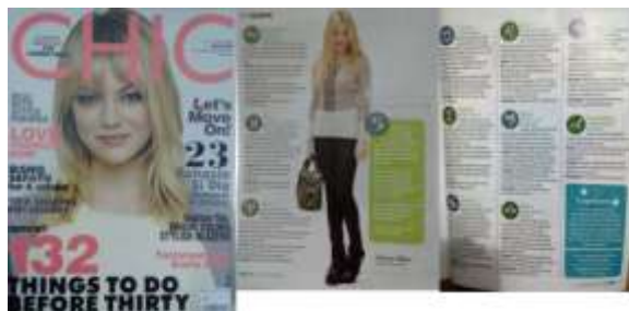
Gambar 2. Chic