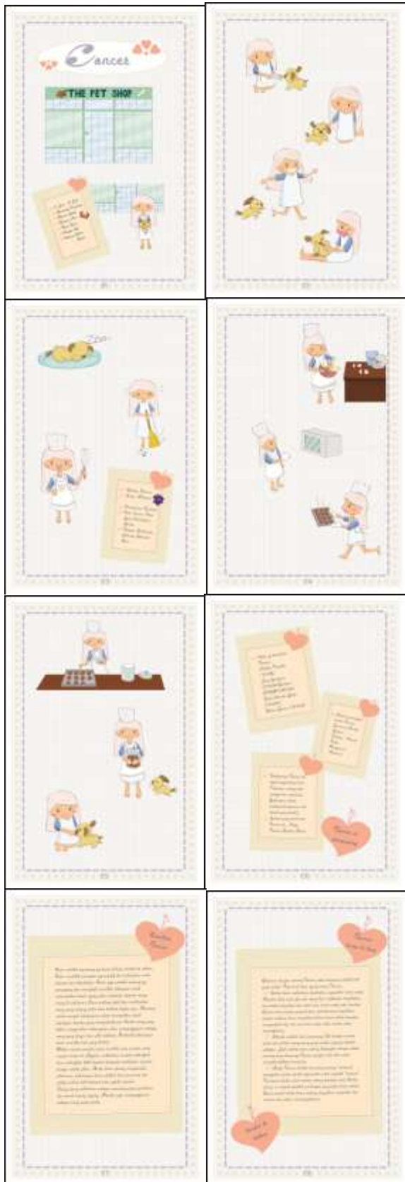
Gambar 8. Cancer