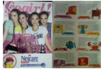
Gambar 3. Go Girl!

Masa remaja adalah masa transisi antara masa anak dan dewasa yang mencakup perubahan biologis, kognitif, dan sosial. Dalam kebanyakan budaya, remaja dimulai pada kira – kira usia 10 sampai 13 tahun, dan berakhir kira – kira usia 18 sampai 22 tahun (Santrock, 2003 : 112). David Elkind (1976) mengemukakan dua hal. Pertama, masalah utama pendidikan yaitu komunikasi. Menurut teori Piaget, pikiran remaja bukanlah lembaran kosong. Sebaliknya, remaja sudah memiliki sejumlah gagasan mengenai dunia fisik dan alami. Kedua, remaja secara alamiah, adalah makhluk yang serba ingin tahu.