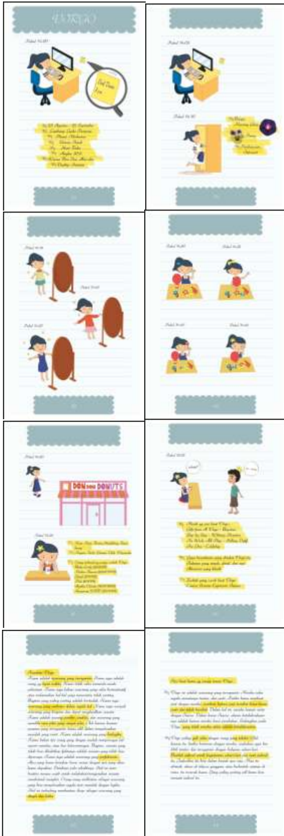
Gambar 10. Virgo