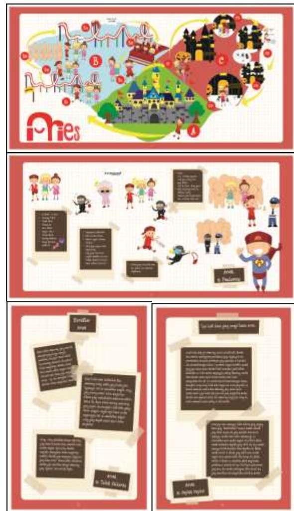
Gambar 5. Aries

Berikut adalah desain akhir dari buku ilustrasi Understanding Zodiac for Female Teenagers :