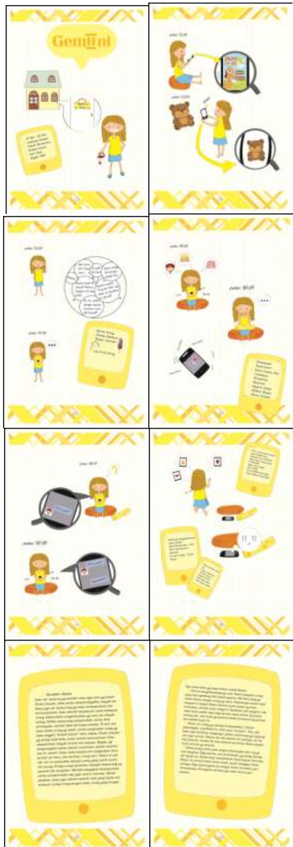
Gambar 7. Gemini