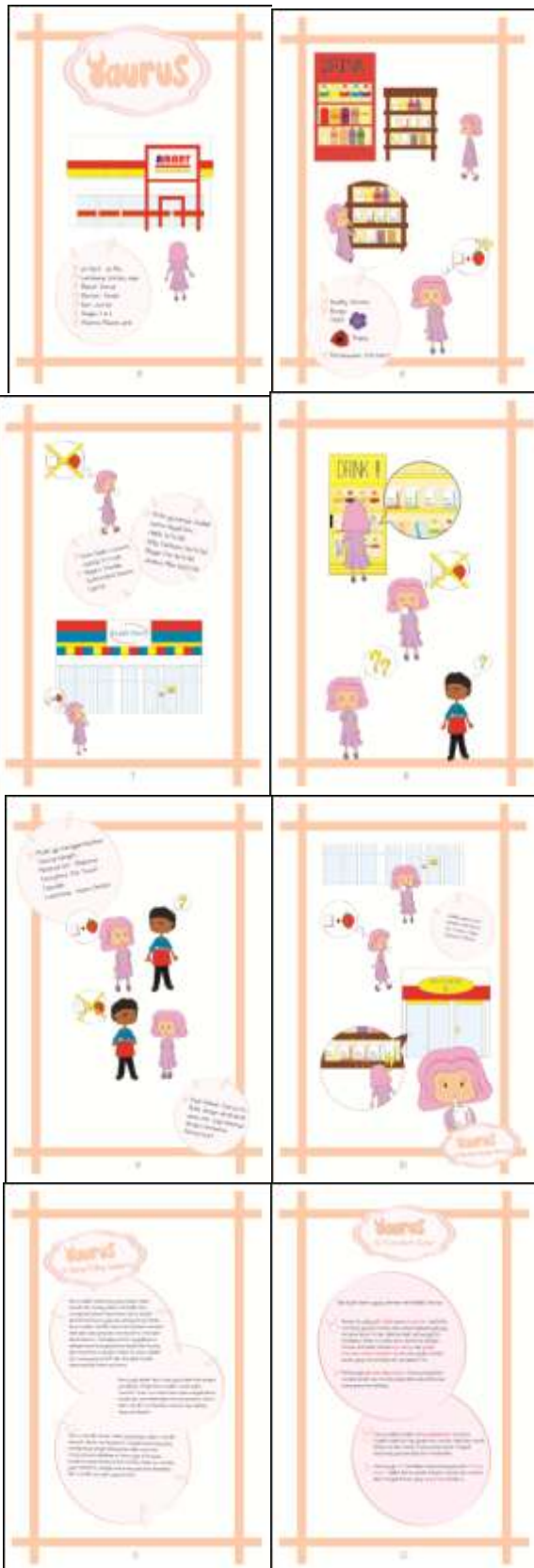
Gambar 6. Taurus