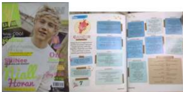
Gambar 1. Kawanku

Di Indonesia, kepercayaan terhadap zodiak dan shio sudah menjadi hal yang umum. Hanya saja untuk shio, lebih menghususkan kepada mereka yang keturunan Cina meski tidak menutup kemungkinan untuk keturunan di luar itu juga mempercayai dan menggunakannya dalam kehidupan sehari – hari. Berdasarkan survey yang dilakukan terhadap para remaja putri usia 12 sampai 17 tahun, menganggap bahwa zodiak menarik untuk diketahui dan menambah pengetahuan bagi mereka yang ingin mengetahuinya. Apalagi melihat fakta hubungan antara zodiak dengan remaja putri melalui keberadaan rubrik zodiak untuk setiap majalah remaja putri yang beredar di Indonesia. Dari hal tersebut, dapat dilihat bahwa sebagian besar remaja putri adalah penggemar zodiak