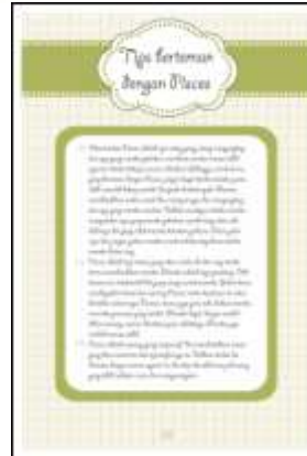
Gambar 16. Pisces