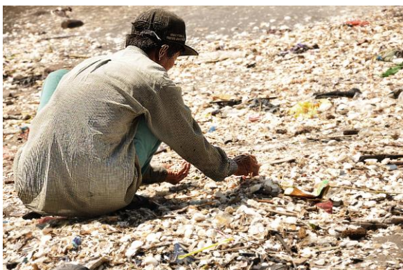
Gambar 3. Mencari Kerang

Sebagai Pengrajin kerang, tentunya penduduk Desa Tambak Deres mencari kerang yang terdapat dipinggir pantai. kerang tersebut akan diambil dengan kondisi yang masih utuh dan layak untuk didaur ulang kembali. Kegiatan mencari kerang dilakukan pada waktu pagi hingga sore hari. Daerah pencarian Kerang yaitu bibir Pantai Kenjeran, Surabaya.