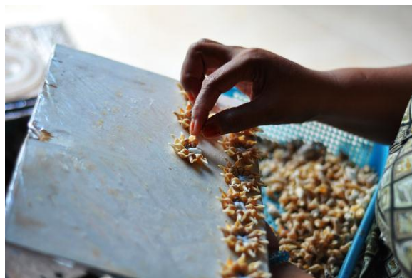
Gambar 6. Proses Pembuatan Kerajinan Kerang

Setelah semua siap, Anda mulai membentuk sesuai pola dan model yang diinginkan. Biasanya sesuai gambar ataupun desain pada komputer. Anda tinggal ikuti contohnya. Kadang hanya perlu menggabungkan berbagai bentuk pola kelopak bunga, menyusun bentuk-bentuk kerang atau keong kecil pada sebuah botol mungil. Semua hasil tergantung kreatifitas para pengrajin kerang.