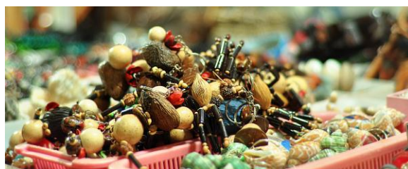
Gambar 7. Kerajinan Kerang

Ada banyak jenis hasil dari kerajinan tangan dengan bahan dasar kerang ini. Semua bagian dari tubuh kerang dapat dijadikan kerajinan tangan yang memiliki keunikan.