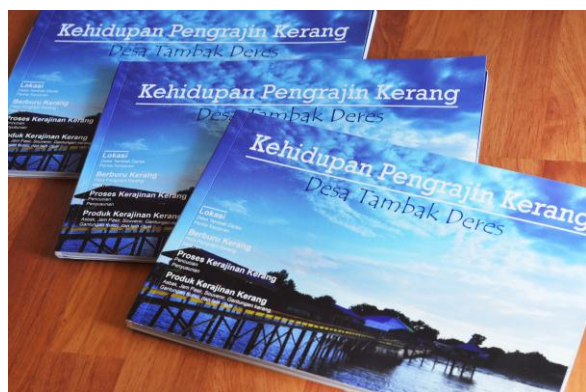
Gambar 9. Cover Buku