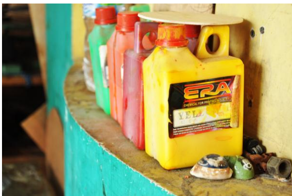
Gambar 1. Bahan Dasar Kerajinan Kerang