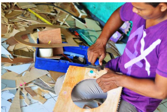
Gambar 5. Proses Pembuatan Pola

Proses produksi ini dilakukan bertahap. Pertama pencucian cangkang dibawah air mengalir atau wadah berisi air. Hal tersebut berguna untuk menghilangkan lumpur atau tanah yang melekat. Kemudian tahap selanjutnya dilakukan pembilasan menggunakan bubuk natrium soda. Adapun fungsi bubuk natrium soda tersebut yaitu berfungsi untuk menghilangkan amis dari cangkang kerang.