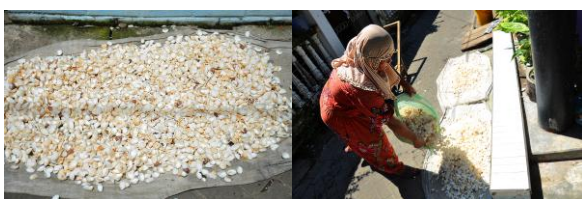
Gambar 4. Proses Pembersihan Kerang

Sebagai Pengrajin kerang, tentunya penduduk Desa Tambak Deres mencari kerang yang terdapat dipinggir pantai. kerang tersebut akan diambil dengan kondisi yang masih utuh dan layak untuk didaur ulang kembali. Kegiatan mencari kerang dilakukan pada waktu pagi hingga sore hari. Daerah pencarian Kerang yaitu bibir Pantai Kenjeran, Surabaya.