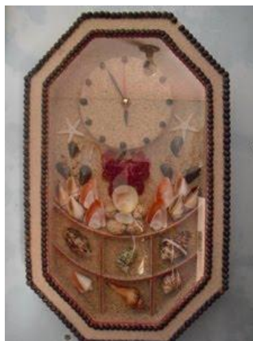
Gambar 2. Kerajinan Kerang