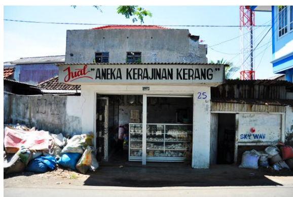
Gambar 8. Toko Penjualan Kerajinan Kerang

Ada banyak jenis hasil dari kerajinan tangan dengan bahan dasar kerang ini. Semua bagian dari tubuh kerang dapat dijadikan kerajinan tangan yang memiliki keunikan.