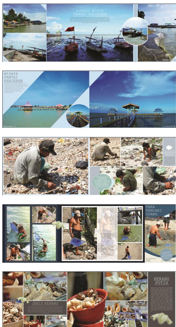
Sumber : Desain oleh Renard Djunaidi (2013) Gambar 10. Layout Buku