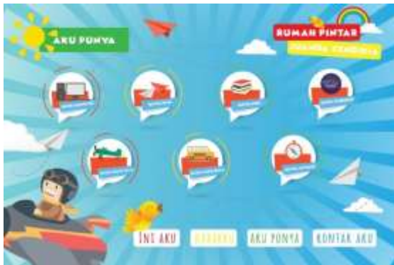
Gambar 4. Final Halaman Fasilitas