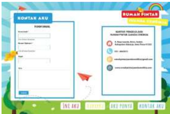
Gambar 5. Final Kontak