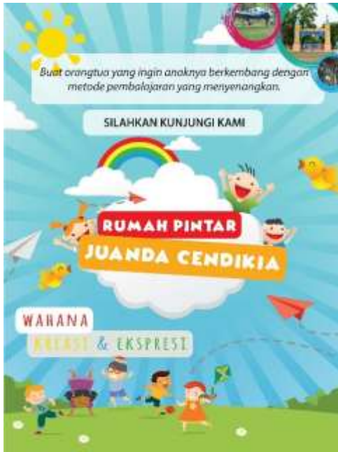
Gambar 6. Brosur Tampak Depan