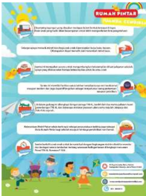
Gambar 7. Brosur Tampak Belakang