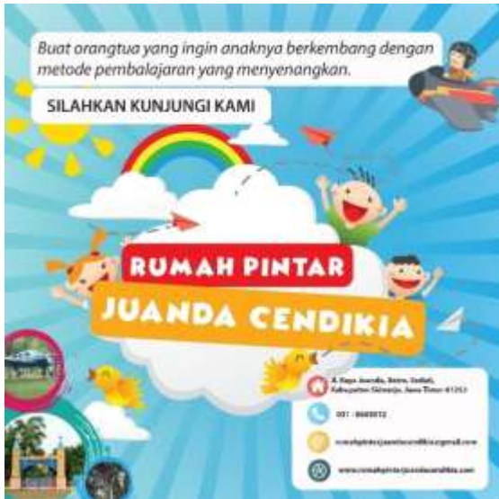
Gambar 8. Poster di Media Sosial Instagram