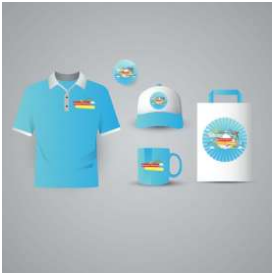
Gambar 9. Merchindase