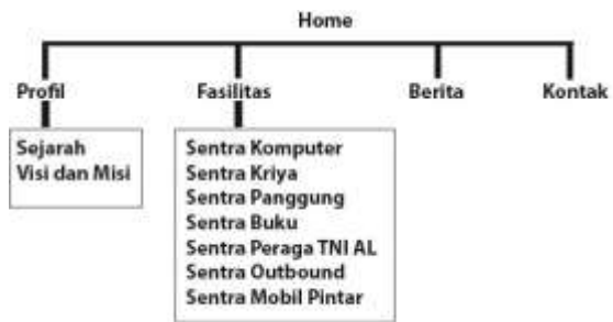
Gambar 1. Alur Desain Interaktif