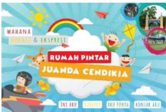
Gambar 3. Final alaman Utama