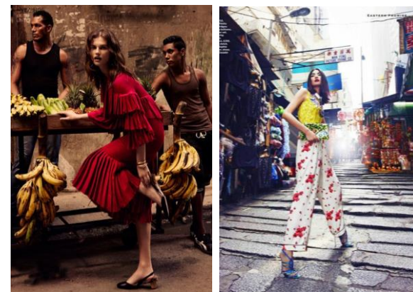
Gambar 1. Fotografi fashion dengan latar outdoor Dantelle Chez for Louis Vuitton 2002, Dolce & Gabbana Sicilian Folk Collection, Havana Days (Marie Claire Magazine U.S.), Xiao Bin Shi for Stylist magazine 2013.