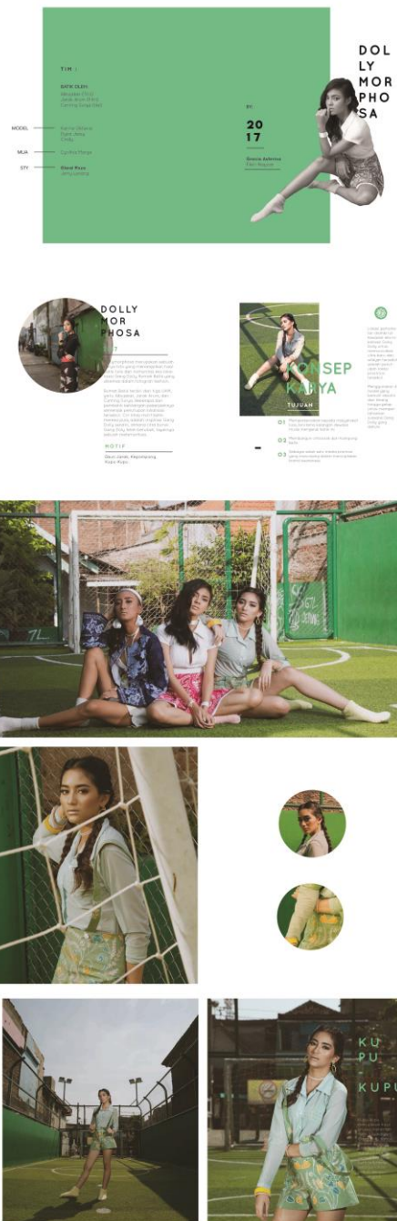
Gambar 3. Seleksi dan final foto