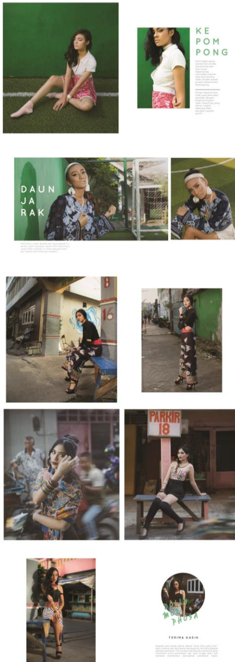
Gambar 4. Penyajian dalam katalog