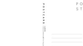
Gambar 5. Penyajian postcard