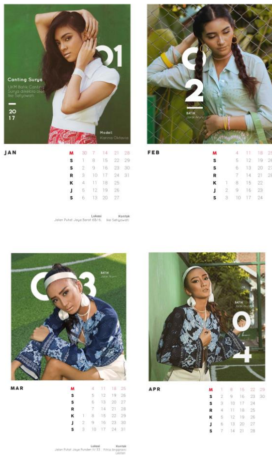
Gambar 6. Penyajian kalender