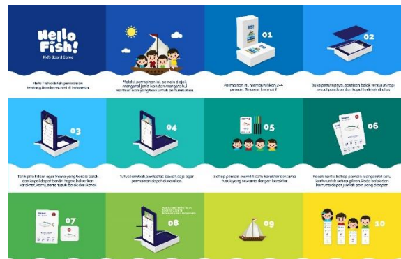
Gambar 9: Final Buku Panduan

Dimulai dari penggalan informasi seputar jenis ikan, nutrisi, kebiasaan anak, serta board game dan gameplay populer yang menarik. Kemudian diambil topik tentang jenis ikan karena anak kurang mengerti perbedaan jenis ikan, selain itu board game dibuat sedemikian rupa agar menunjukkan bahwa anak yang memakan ikan bergizi paling banyak akan menjadi lebih superior dengan menjadi pemenang dalam game , dibandingkan teman-temannya yang makan ikan lebih sedikit. Dari situlah anak diajak mengonsumsi ikan lebih sering sambil didedukasi mengenai jenis ikan konsumsi yang ada di Indonesia.