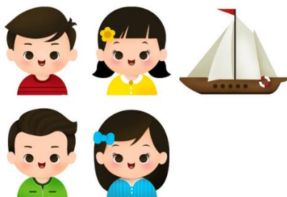
Gambar 7: Final Karakter & Kapal