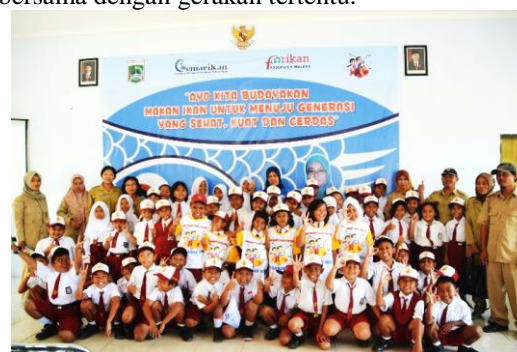
Gambar 5: Sosialisasi Gemarikan di SD