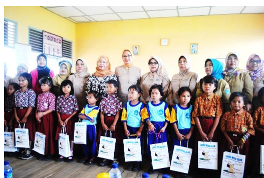
Gambar 2: PMTAS