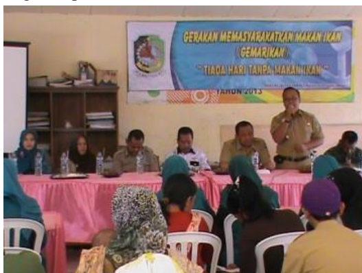
Gambar 1: Talkshow Gemarikan di Banyuwangi