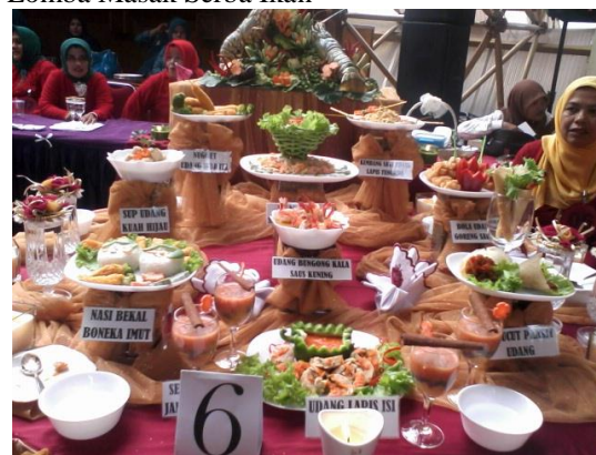
Gambar 4: Lomba Masak Serba Ikan

Lomba serupa diadakan di berbagai kota di Indonesia. Kegiatan lomba ini diadakan setiap tahun mulai tahun 2013. Target konsumennya merupakan ibu-ibu yang gemar memasak. Event ini berhadiah uang tunai sehingga menarik untuk diikuti. Masakan yang sudah dilombakan nantinya dimakan bersama oleh seluruh peserta.