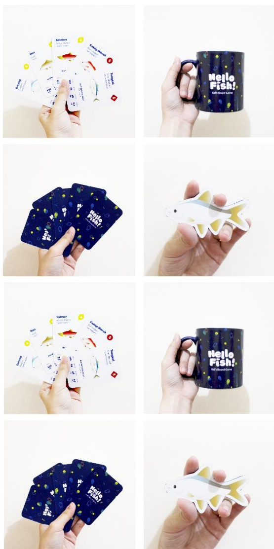
Gambar 11: Merchandise