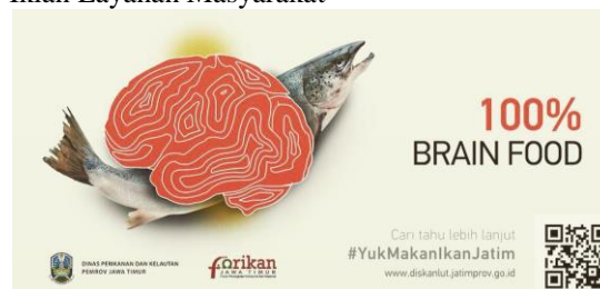
Gambar 3: Billboard Gemarikan di Surabaya

Diskanlut Jatim memasang berbagai iklan layanan masyarakat di billboard yang ada di Jawa Timur. Tujuan pemasangan iklan ini untuk menghimbau dan mengedukasi masyarakat yang lewat di jalan tersebut tentang pentingnya mengonsumsi ikan