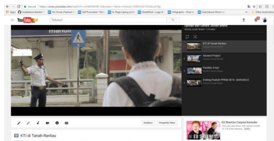
Gambar 6. Tampilan Distribusi Melalui Media Facebook .