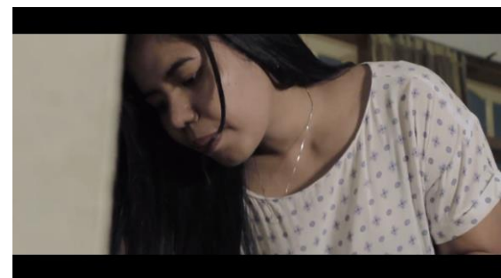
Gambar 3. Tampilan aktifitas narasumber alumni KTI