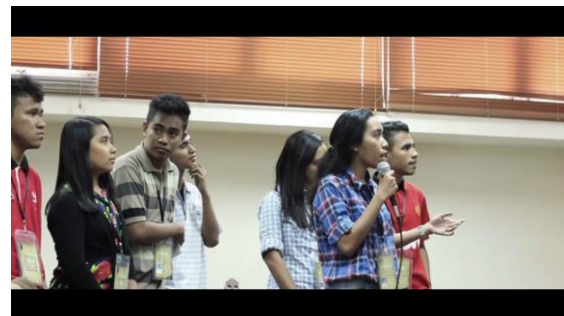
Gambar 2. Tampilan kegiatan mahasiswa KTI