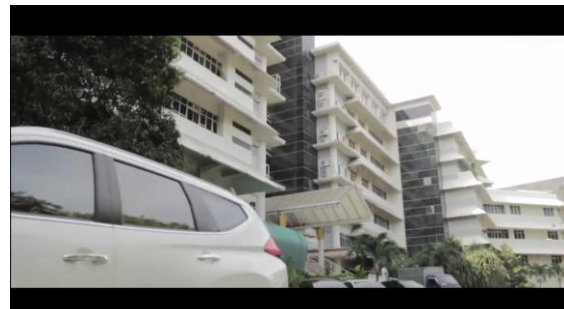
Gambar 1. Tampilan kampus gedung P UK Petra