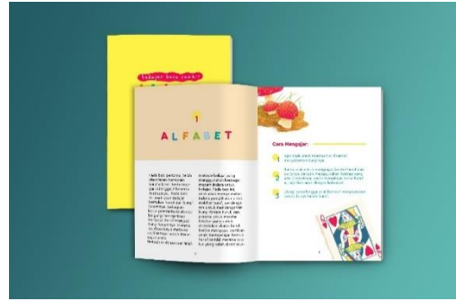
Gambar 7. Mockup buku panduan orangtua 1