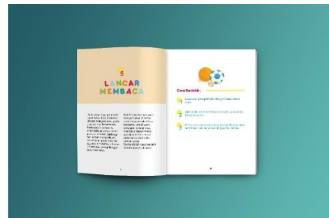
Gambar 8. Mockup buku panduan orangtua 2