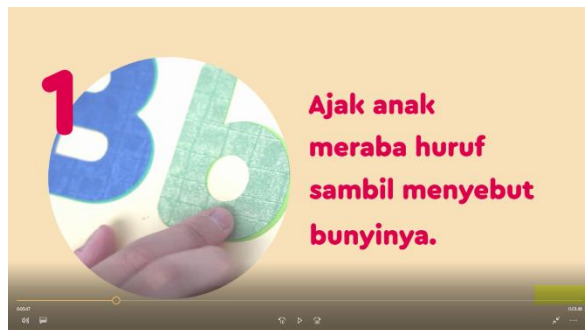
Gambar 12. Screen capture video panduan orangtua 3