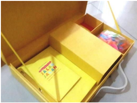
Gambar 17. Packaging perancangan 2