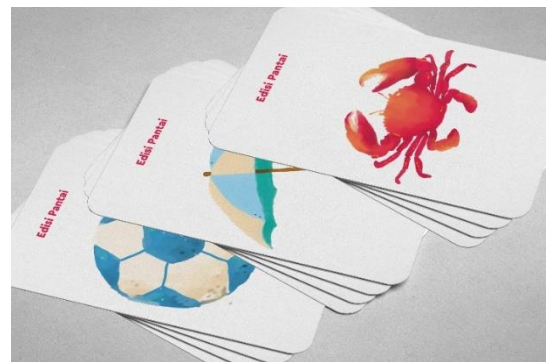
Gambar 15. Mockup Flashcard 2