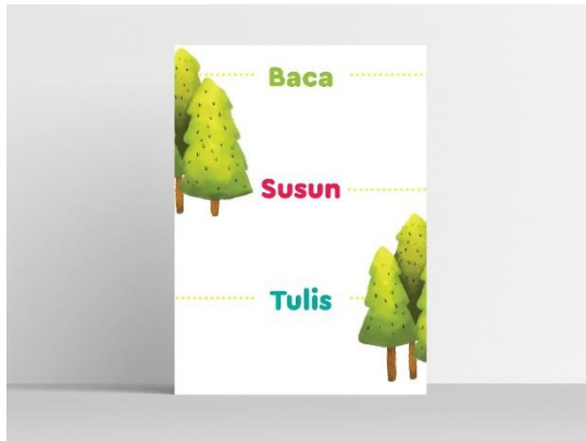
Gambar 18. Kartu baca susun tulis