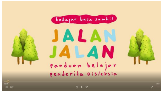
Gambar 10. Screen capture video panduan orangtua 1