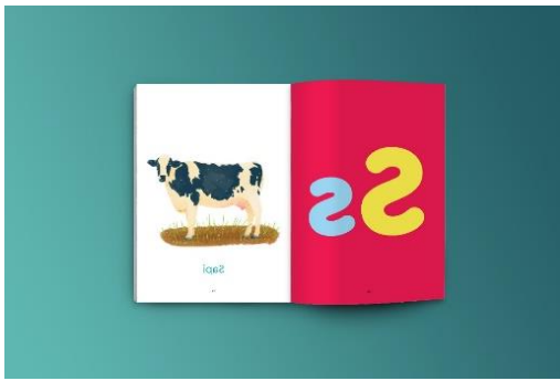
Gambar 4. Mockup buku belajar anak 3