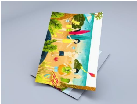
Gambar 5. Ilustrasi hidden object pantai