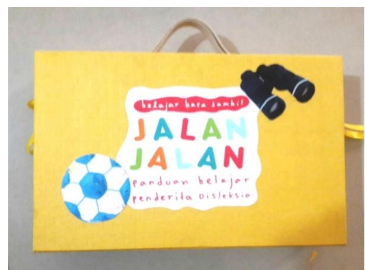
Gambar 16. Packaging perancangan z