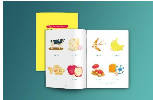
Gambar 2. Mockup buku belajar anak 1