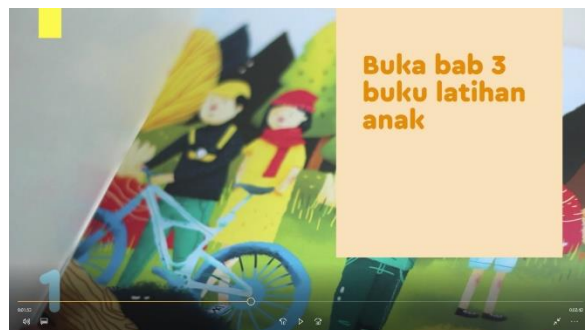
Gambar 13. Screen capture video panduan orangtua 4