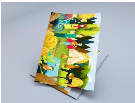
Gambar 6. Ilustrasi hidden object gunung