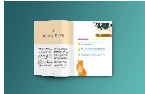
Gambar 9. Mockup buku panduan orangtua 3