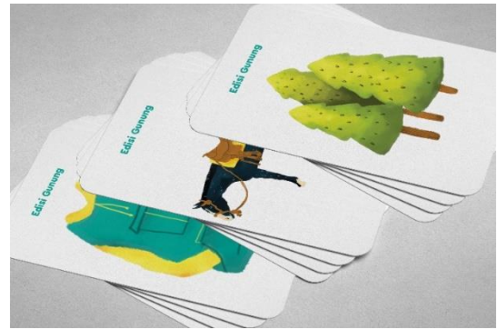
Gambar 14. Mockup Flashcard 1