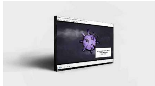
Gambar 2. Contoh video