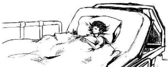
Gambar 1. Contoh teknik visual

Teknik pengerjaan adalah dengan menggunakan teknik motion comic . Visualisasi dari video nampak gelap dengan cahaya kuning yang kontras yang sering digunakan pada komik-komik misteri.