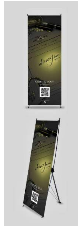
Gambar 4. Contoh Media pendukung