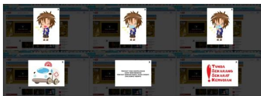
Gambar14. Desain popup browser