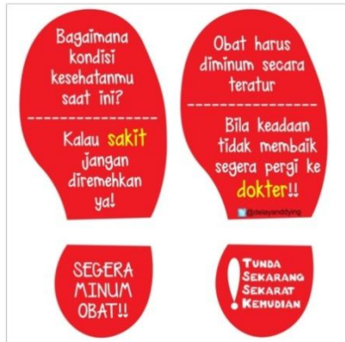
Gambar11. Desain ambient kaki