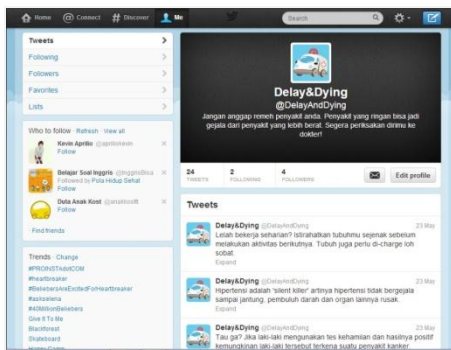
Gambar 13. Twitter