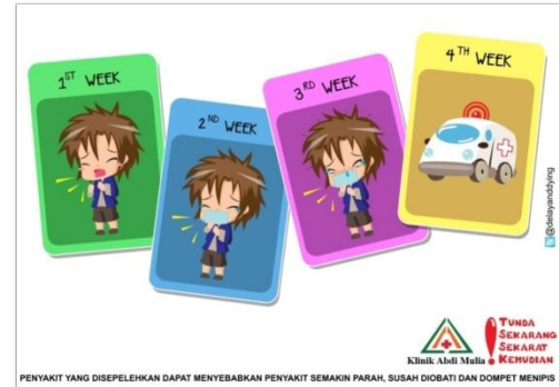
Gambar1. Desain poster

yang mencakup buku, surat kabar, majalah, dan situs internet.