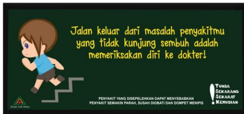
Gambar12. Desain ambient exit door