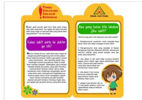
Gambar2. Desain brosur