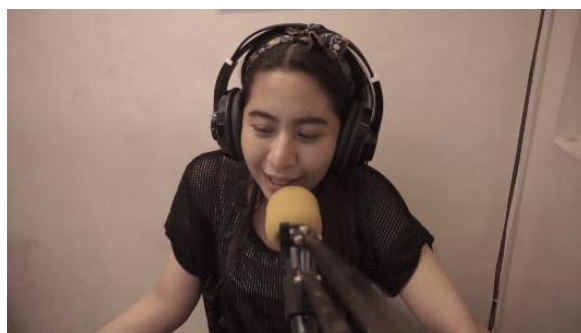
Gambar 7. Hasil akhir