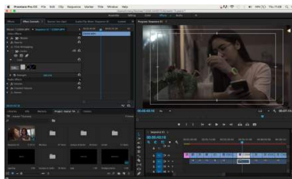
Gambar 2. Editing

Proses produksi berjalan sesuai dengan rencana yang telah dibuat dalam proses pra-produksi. setelahnya akan dilanjutkan dengan proses pasca produksi yang diawali dengan editing , menggunakan aplikasi adobe premiere pro cc 2015