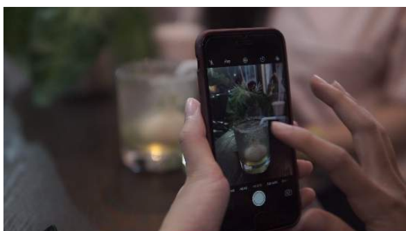
Gambar 6. Hasil akhir