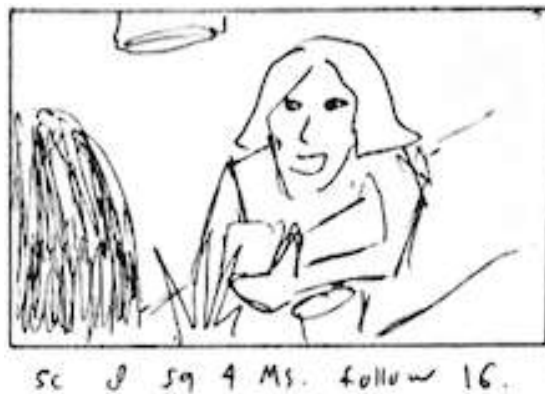
Gambar 1. Storyboard

Pada proses pra-produksi, dilakukan berbagai persiapan untuk melakukan produksi. pada bagian awal adalah pengembangan sinopsis menjadi sebuah script yang berisi tentang detail cerita. Setelahnya adalah pembuatan storyboard yang berisi detail pengambilan gambar berupa angle , dan frame kamera.