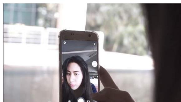
Gambar 8. Hasil akhir

Setelah melalui proses pasca-produksi maka didapatkan hasil akhir berupa karya film pendek dengan durasi 15 menit berjudul ombak.