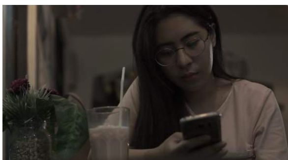
Gambar 5. Hasil akhir

Setelah melalui proses pasca-produksi maka didapatkan hasil akhir berupa karya film pendek dengan durasi 15 menit berjudul ombak.