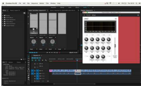
Gambar 3. Sound Editing