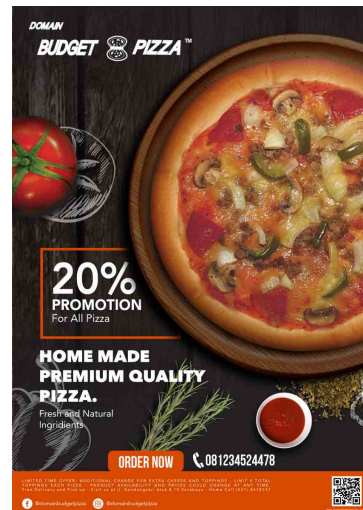
Gambar 3. Desain Facebook dan Instagram

Poster ini akan ditempatkan pada tempat – tempat strategis yang dekat dengan TA, Poster dipilih untuk menampilkan fasilitas - fasilitas dan media promosi secara langsung dapat dilihat dan mampu menarik konsumen yang sering melakukan mobilitas di luar dan di tempat-tempat umum.