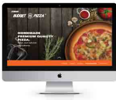
Gambar 2. Desain Website

Website digunakan sebagai salah satu media promosi, melalui website orang dapat mengetahui lebih banyak mengenai Domain Budget Pizza dan juga dapat memesan melalui website . Terdapat QR CODE di media lain seperti poster, brosur, dan kemasan yang dapat tersambung langsung ke website dari Domain Budget Pizza.