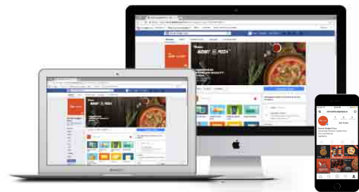
Gambar 1. Desain Facebook dan Instagram

Penggunaan social media dinilai cukup efektif untuk meraih awareness , dimana hampir semua orang di dunia sudah memiliki account facebook dan instagram. Oleh karena itu media ini dipilih karena tepat dan efektif untuk mempromosikan Domain Budget Pizza melalui media sosial dengan target yang dituju melalui media ini adalah anak muda. Media sosial ini bersifat gratis dan tanpa biaya sama sekali sehingga mendukung untuk menghemat biaya promosi.