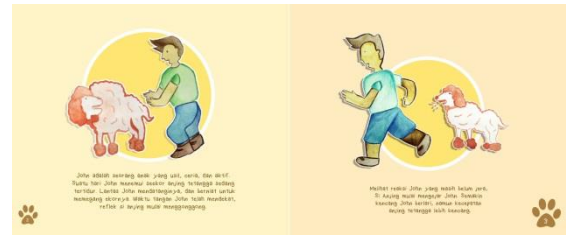
Gambar 2. Isi Buku Ilustrasi