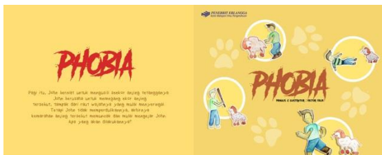
Gambar 1. Cover Buku Ilustrasi