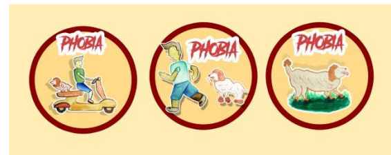
Gambar 4. Desain Pin