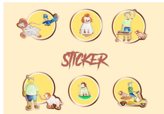
Gambar 5. Desain Sticker