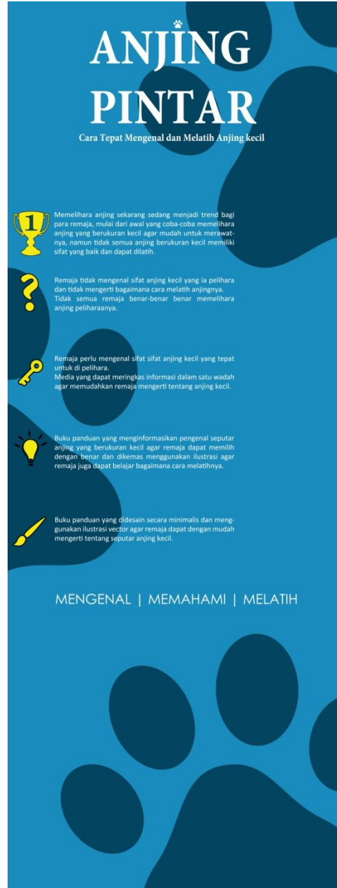
Gambar 5. X-banner