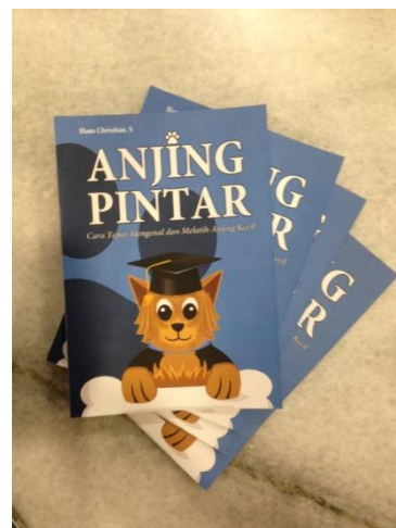
Gambar 1. Buku Panduan

X-banner adalah media promosi kedua saat launching dari buku panduan ini, x-banner ini akan memberikan sedikit tentang informasi apa isi dari buku panduan ini agar dapat menarik minat dari pembeli.