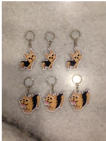
Gambar 3. Gantungan kunci