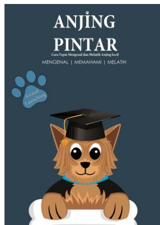
Gambar 4. Poster