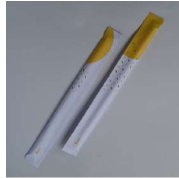
Gambar 25. Pembungkus sedotan