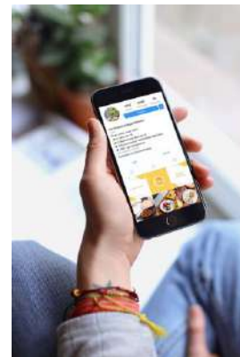
Gambar 26. Instagram

Instagram digunakan sebagai sumber informasi sebelum target audience memutuskan untuk mengunjungi Toko Kue Mama. Di media ini akan terdapat informasi berupa foto-foto produk dan tempat dari Toko Kue Mama.