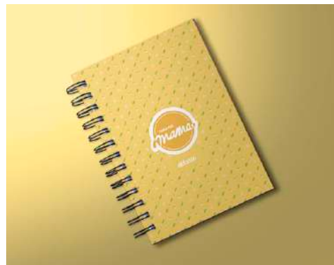
Gambar 19. Notes