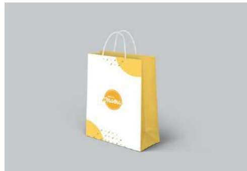
Gambar 13. Paperbag