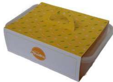
Gambar 12. Kemasan take-away

Kemasan yang dibutuhkan adalah kemasan take-away . Kotak makan plastik akan digunakan sebagai wadah langsung untuk produk-produk Toko Kue Mama, dengan konsep bekal dari Mama. Selain itu, kemasan paperbag juga perlu sebagai kemasan sekunder. Kemasan-kemasan ini juga berfungsi sebagai sarana promosi, karena pada kemasan akan terdapat elemen dari Toko Kue Mama. Kemasan lainnya yang dibutuhkan adalah cup es krim .