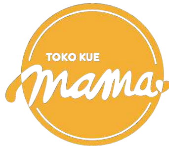
Gambar 2. Logo baru Toko Kue Mama

Logo berbentuk bulat dan berwarna jingga seperti matahari melambangkan kehangatan dan kasih ibu yang terus menerus. Terdapat dua garis setengah lingkaran yang melambangkan pelukan ibu. Kemudian tulisan mama dan bentuk hati yang menggambarkan kasih seorang ibu. Konsep keseluruhannya menggambarkan cinta kasih seorang ibu yang tidak pernah berhenti.