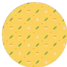
Gambar 24. Tatakan minum