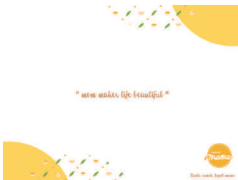
Gambar 23. Tatakan makanan