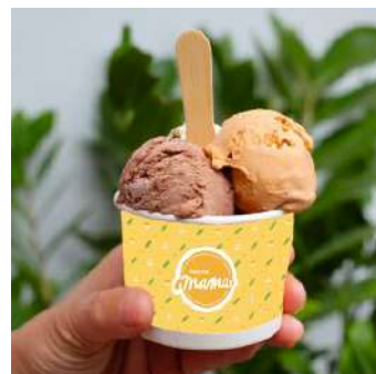
Gambar 14. Cup es krim