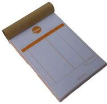
Gambar 21. Nota pesanan