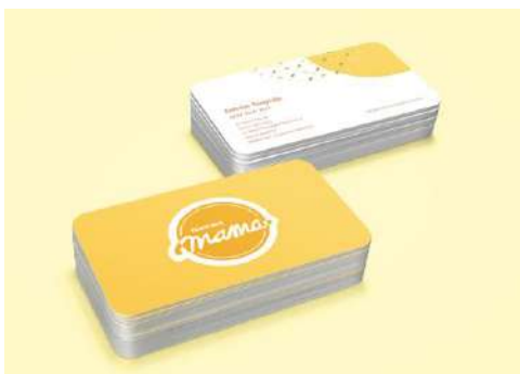
Gambar 16. Kartu nama

Stationary yang akan dibuat adalah kartu nama, kop surat, amplop, notes , stempel, nota pesanan, label kue, tatakan makanan dan minuman, serta pembungkus sedotan.