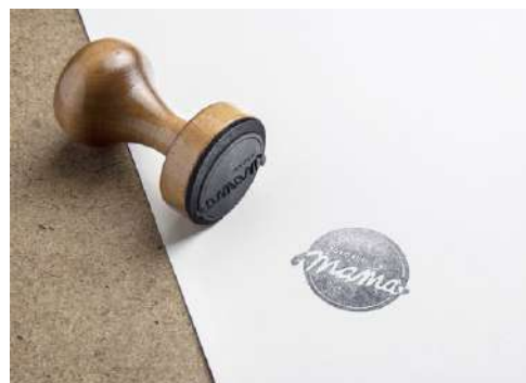
Gambar 20. Stempel