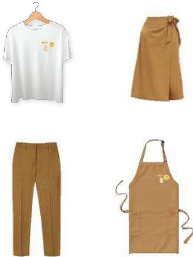
Gambar 15. Seragam (T-shirt, Kulot, Celana, Apron)

Seragam bagi para pekerja di Toko Kue Mama agar pekerja-pekerja lebih terlihat profesional. Seragam untuk pelayan berupa atasan dan rok bagi wanita, celana bagi pria. Sedangkan untuk koki dan pekerja di bagian kitchen akan menggunakan apron . Pada t-shirt dan apron akan dipasang tiga badge yaitu logo, slogan, dan nama karyawan.