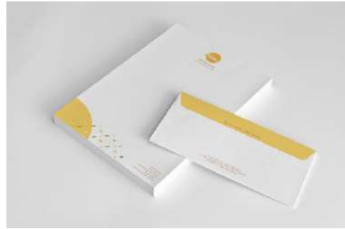
Gambar 17. Kop surat