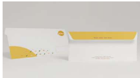
Gambar 18. Amplop