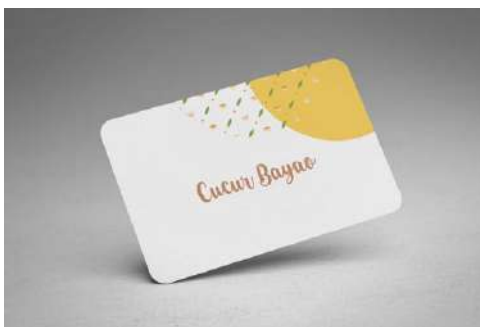
Gambar 22. Label kue