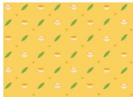
Gambar 9. Pattern background kuning