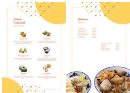
Gambar 11. Isi Buku Menu