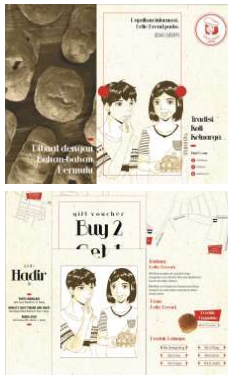
Gambar 7. Brosur edisi kedua