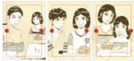
Gambar 19. Cover notes bagian depan