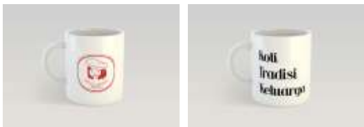
Gambar 22. Mug sisi depan dan belakang