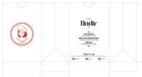
Gambar 18. Kerangka paperbag