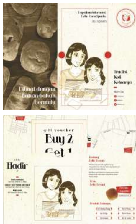
Gambar 6. Brosur edisi pertama