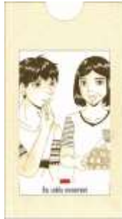
Gambar 15. Pengaplikasian pada kartu nama