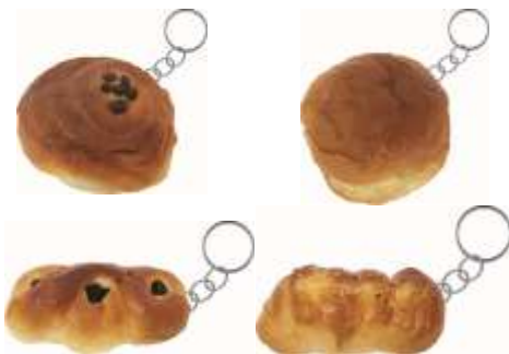
Gambar 23. Beberapa bentuk gantungan kunci