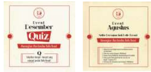
Gambar 12. Beberapa image untuk Instagram

e. Media Sosial (Instagram dan Facebook)