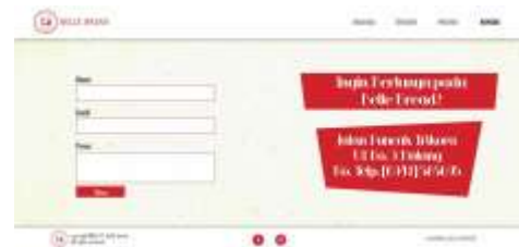
Gambar 10. Tampilan website versi desktop