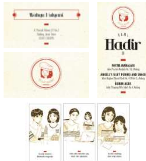
Gambar 14. Bagian-bagian pada kartu nama