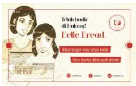
Gambar 5. Iklan Koran