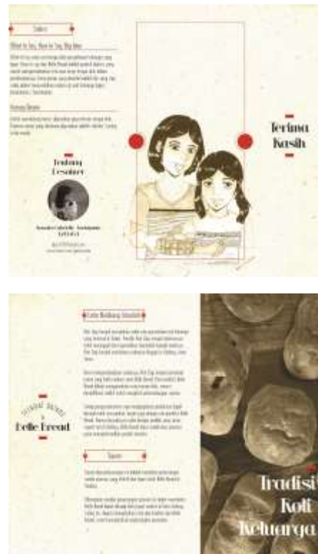
Gambar 25. Katalog bagian depan dan belakang