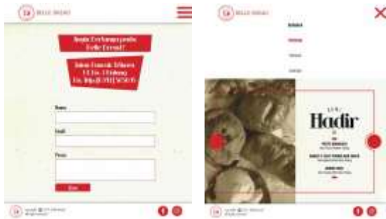
Gambar 11. Tampilan website versi mobile

e. Media Sosial (Instagram dan Facebook)