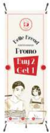
Gambar 16. Pengaplikasian pada banner