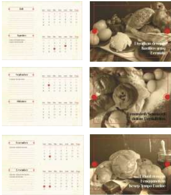
Gambar 21. Pengaplikasian kalender