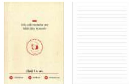
Gambar 20. Cover notes bagian belakang dan isi