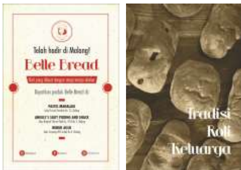
Gambar 9. Flyer bagian depan dan belakang