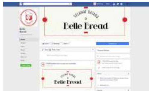
Gambar 13. Tampilan Facebook