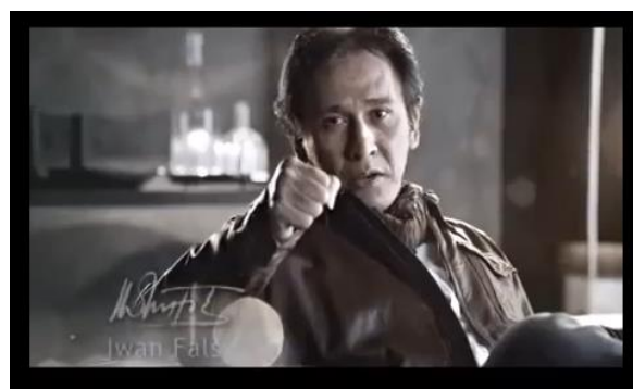
Gambar 1. Iwan Fals