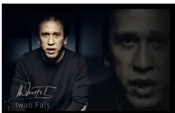
Gambar 2. Iwan Fals

Duduk dengan menyilangkan kaki (pergelangan kaki yang satu bertumpu pada lutut kaki yang lainnya) memberi kesan santai. Posisi duduk seperti ini biasanya dilakukan oleh laki-laki (khususnya laki-laki muda) untuk menunjukkan sisi maskulin atas gendernya sebagai seorang laki-laki. Posisi duduk ini berasal dari kebiasaan duduk para 'cowboy' terkait dengan gaya hidup dan penampilan mereka. Posisi duduk ini berasal dari barat yang mana dipopulerkan oleh Amerika Serikat dan negara-negara mid-west .