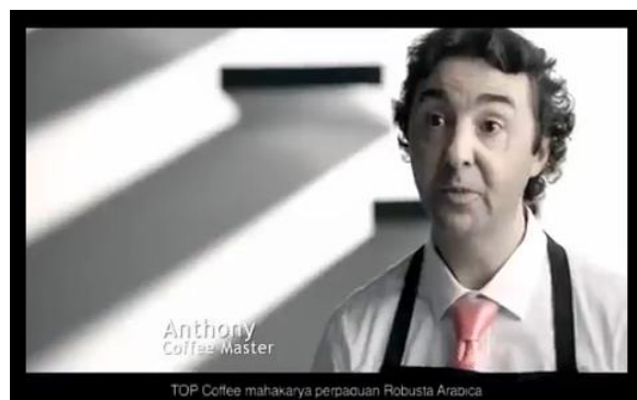
Gambar 3. Anthony

Kesan serius dan tegas tersebut tampak dari pencahayaan satu arah yang difokuskan pada wajah Iwan Fals; pandangan mata yang lurus ke depan; latar yang didominasi warna hitam untuk memberikan makna misteri, kekuasaan, dan kewenangan; teknik pengambilan kamera middle close up untuk memperlihatkan emosi yang tampak Iwan Fals; pengulangan wajah Iwan Fals dengan teknik pengambilan kamera secara big close up sehingga raut wajah dan kedalaman pandangan mata Iwan Fals nampak jelas