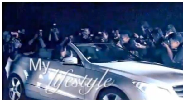
Gambar 7. Nikita Willy

minimalis yang bersifat modern. Pakaian ini menunjukkan mengenai sisi modernitas dari figur seorang Nikita Willy. Kesan menggoda juga tampak pada gambar ini. Hal tersebut dapat terlihat dari postur badan Nikita yang cenderung seksi (kaki kiri yang tertekuk ke samping yang berada di atas lutut). Selain postur badan, gestur tangan dan kaki serta mimik wajah Nikita juga memperkuat kesan seksi tersebut.