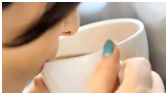
Gambar 9. Nikita Willy

Menjamurnya keberadaan budaya “ngafe” dan cafe sebagai gaya hidup alternatif baru bagi kalangan muda merupakan sebuah fenomena atas masih tertanam kuatnya pengaruh budaya barat sebagai trendsetter dalam kehidupan masyarakat Indonesia.