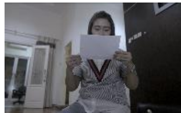
Gambar 11. Ibu membaca surat dari bibi