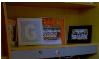
Gambar 3. Pembukaan video ILM

Menggunakan media audio visual sebagai media utama untuk menginformasikan secara langsung mengenai dampak dari tidak mengurus anaknya sendiri. Konsep naskah audio visual adalah anak yang ditinggalkan oleh orang tua dititipkan kepada pembantu. Pembantu menyiapkan makan, memperhatikan anak, sehingga hubungan anak lebih dekat dengan pembantu dibandingkan dengan orang tua. Pendekatan emosional yang membuat anak lebih menyayangi pembantu dibandingkan orang tuanya. Media ini diputar dalam seminar “ Scientific Hypnosis and Hypnotherapy for Parents ” dan diunggah ke media sosial.