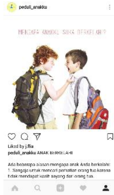
Gambar 18. Tips parenting di Instagram