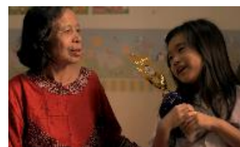
Gambar 13. Ibu menyadari bahwa bibi yang selalu mengajak anaknya berbicara