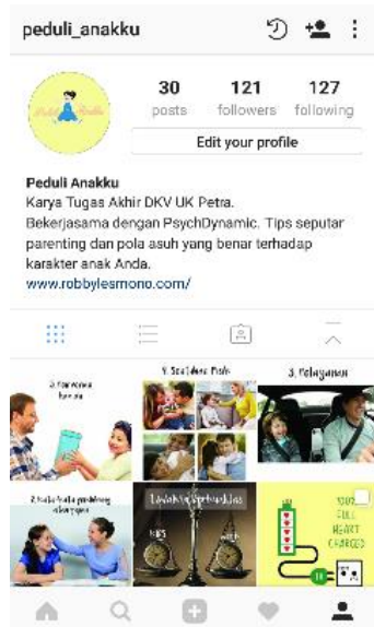
Gambar 17. Media sosial ILM

Menggunakan media sosial yang paling sering digunakan oleh orang tua yaitu Instagram . Media ini akan ada selama dua bulan untuk membagikan tips-tips seputar pola asuh yang baik untuk diterapkan pada anak. Selain itu, media bisa menjadi wadah bagi semua orang untuk berbagi.