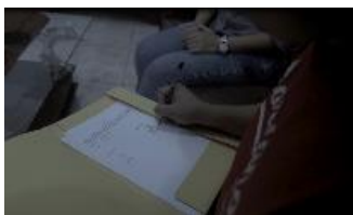
Gambar 4. Ibu sedang bekerja sampai larut malam