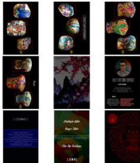
Gambar 2. Isi buku awal hingga akhir