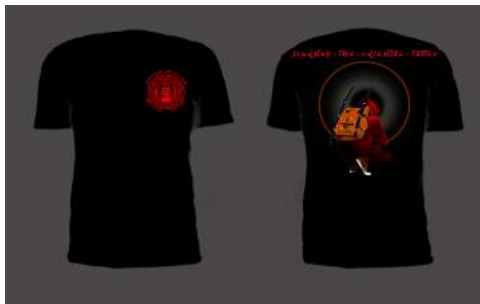
Gambar 9. Baju