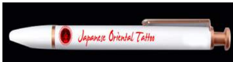
Gambar 8. Bolpoin