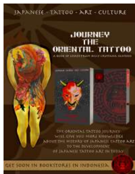
Gambar 4. Brosur