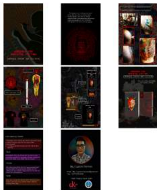
Gambar 10. Katalog