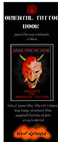
Gambar 5. X-banner