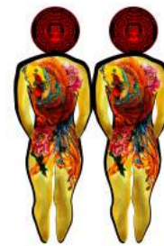
Gambar 6. Pembatas buku