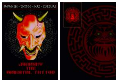
Gambar 1. Cover Buku