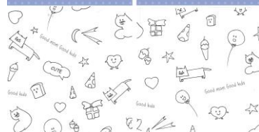
Gambar 4. Layout Isi Buku