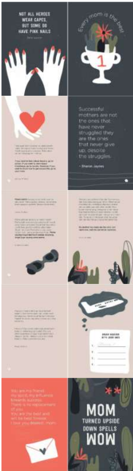
Gambar 9. Halaman 9-18