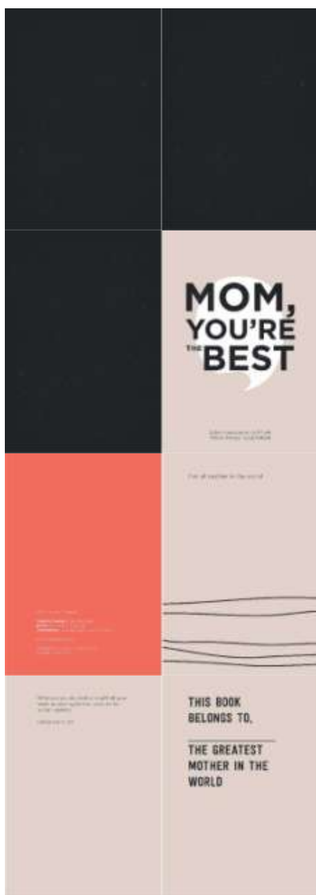
Gambar 8. Halaman Indeks