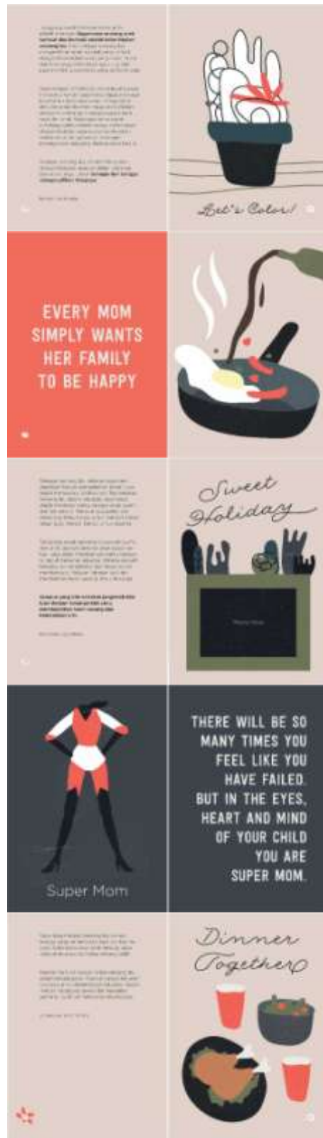
Gambar 12. Halaman 39-48