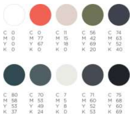
Gambar 1. Warna

Warna merah coral memberikan kehangatan, dan tenaga. Warna ini membangkitkan emosi dan memotivasi untuk melakukan sesuatu. Selain itu, berkemauan keras dan dapat memberikan rasa percaya diri untuk mereka yang pemalu dan mereka yang kurang memiliki kemauan ( The Color Red , n.d.)