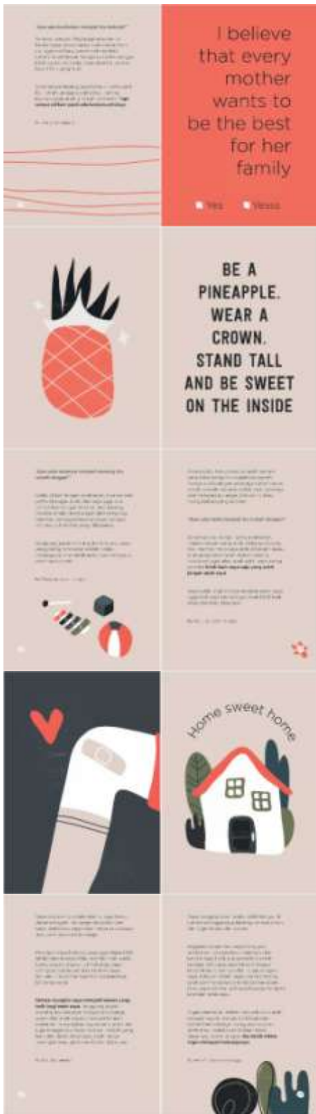
Gambar 11. Halaman 29-38