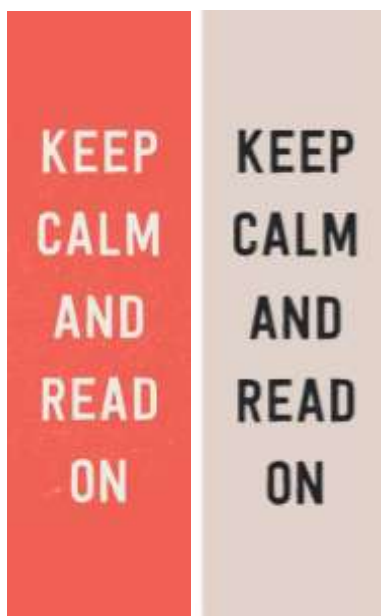
Gambar 17. Desain Pembatas Buku