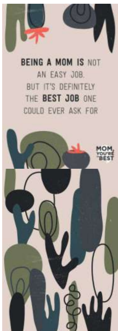
Gambar 18. Desain Cover Notes