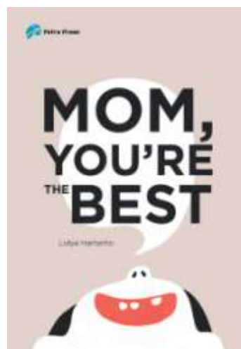
Gambar 15. Cover Depan