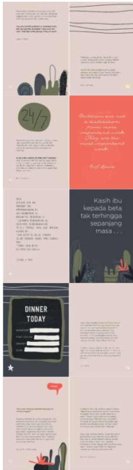
Gambar 10. Halaman 19-28