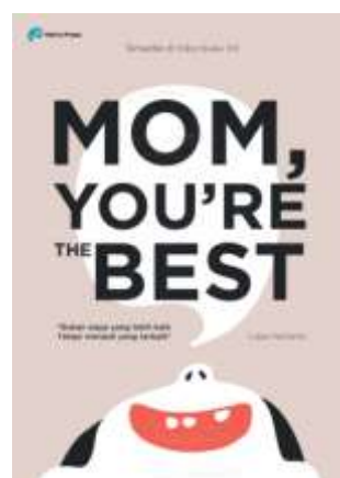
Gambar 20. Desain Poster Promosi