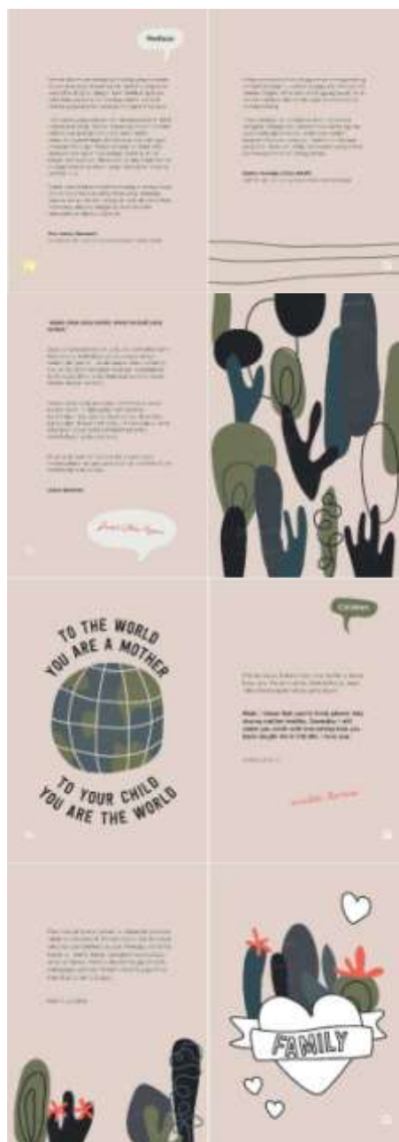
Gambar 9. Halaman 1-8