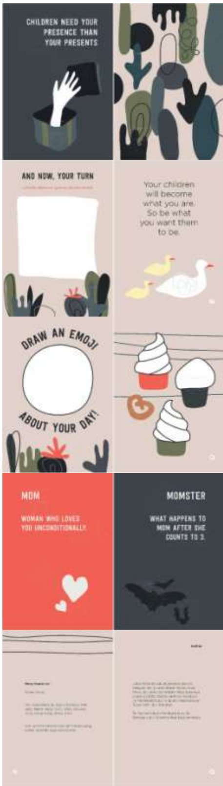
Gambar 13. Halaman 49-58