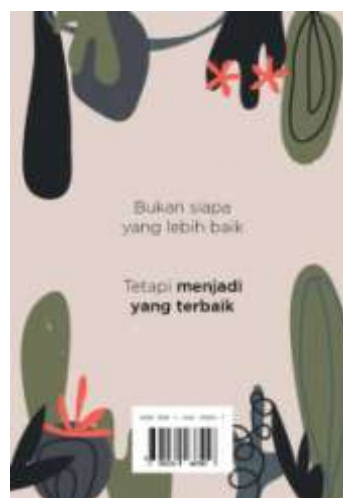
Gambar 16. Cover Belakang