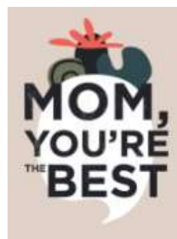
Gambar 19. Desain Sticker