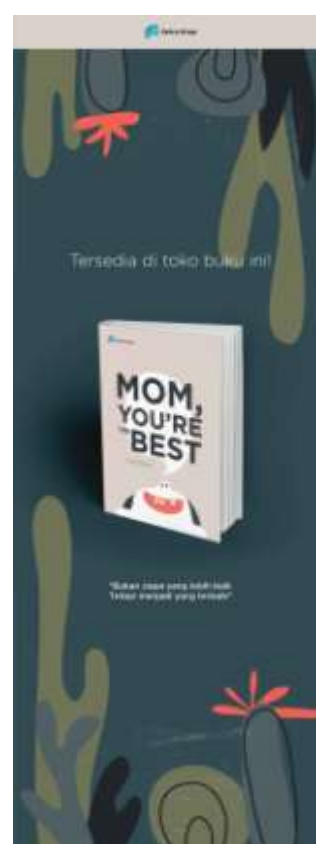
Gambar 21. Desain X-Banner