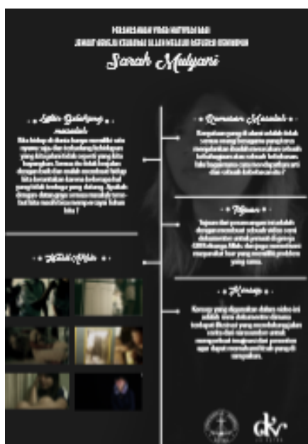
Gambar 2. Poster film