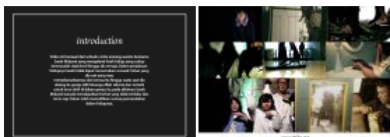
Gambar 1. Katalog karya