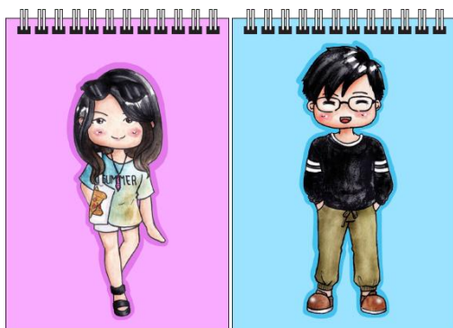
Gambar 9. Contoh notes