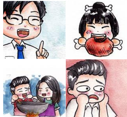
Gambar 2. Cover episode