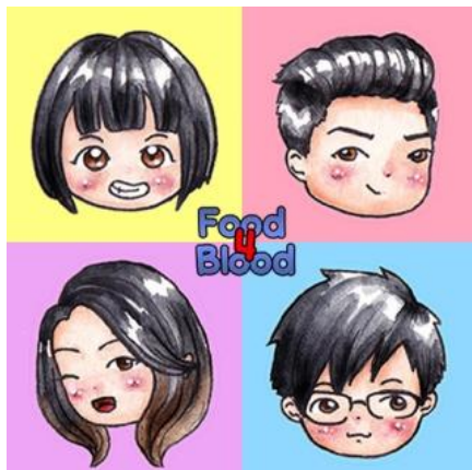
Gambar 1. Cover Webtoon utama