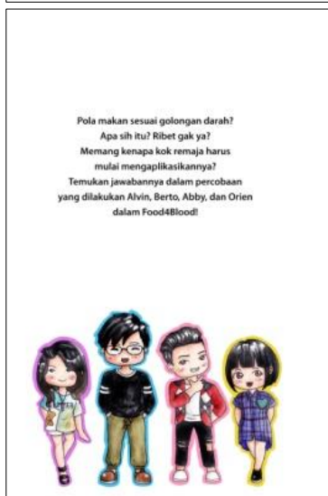
Gambar 5. Contoh cover buku