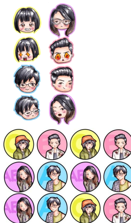
Gambar 7. Contoh sticker