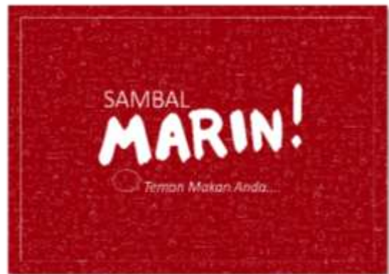
Gambar 23. Alas Piring