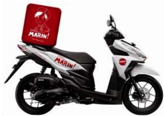
Gambar 28. Vehicle Identity