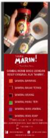
Gambar 14. X-Banner