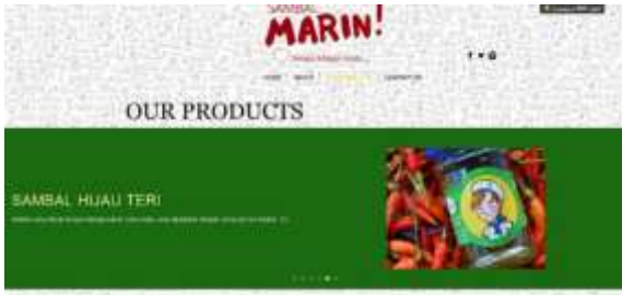
Gambar 8. Website