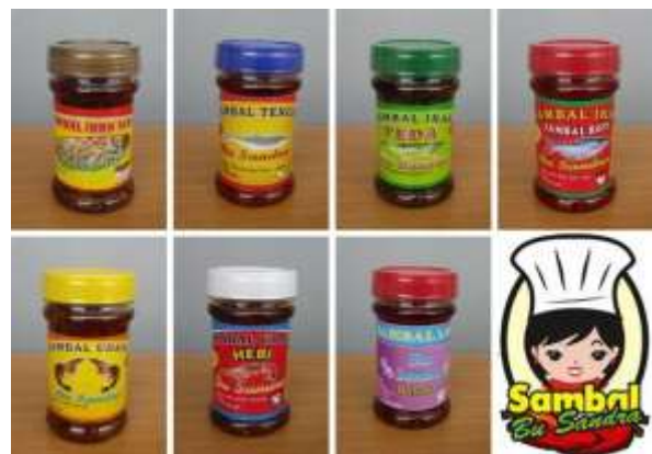
Gambar 6. Produk Sambal Bu Sandra

Sambal Bu Sandra tidak hanya berisi cabe tetapi terdapat juga potongan ikan di dalamnya. Hal ini menunjukkan bahwa sambal Bu Sandra menggunakan bahan baku asli. Sambal Bu Sandra dikemas dengan seal aluminium pada bagian tutup sehingga aman untuk pengiriman di pulau Jawa maupun luar Jawa.