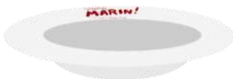
Gambar 21. Mangkok Sambal