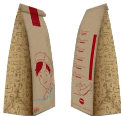
Gambar 17. Packaging 1