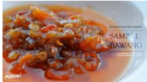
Gambar 2. Sambal Bawang