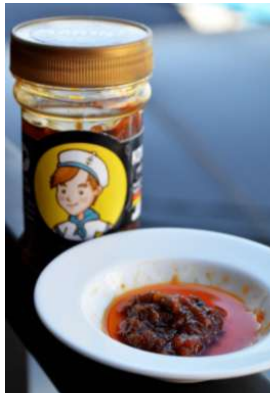
Gambar 3. Sambal Bawang