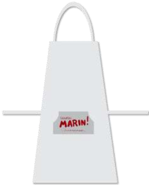
Gambar 25. Apron