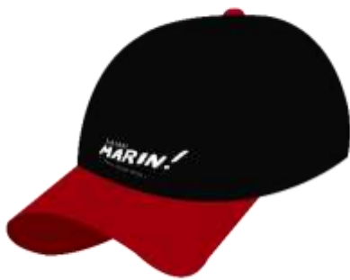
Gambar 26. Topi