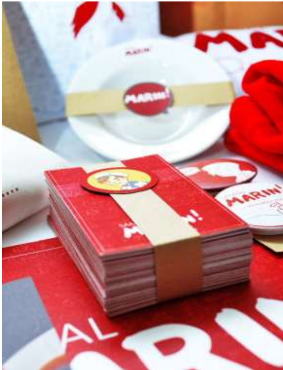
Gambar 29. Final Design