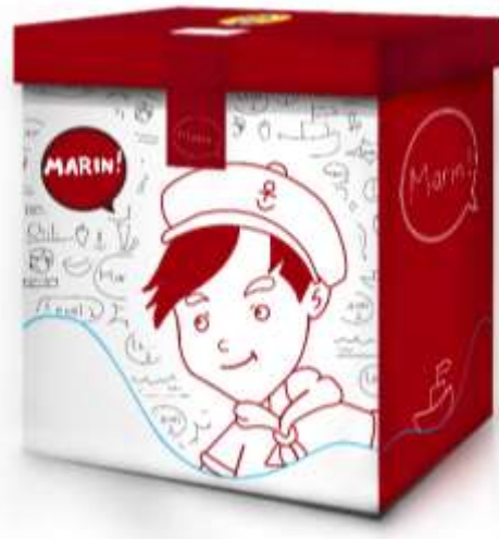
Gambar 16. Packaging Dus