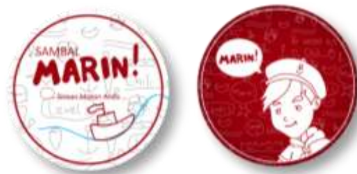
Gambar 24. Pin