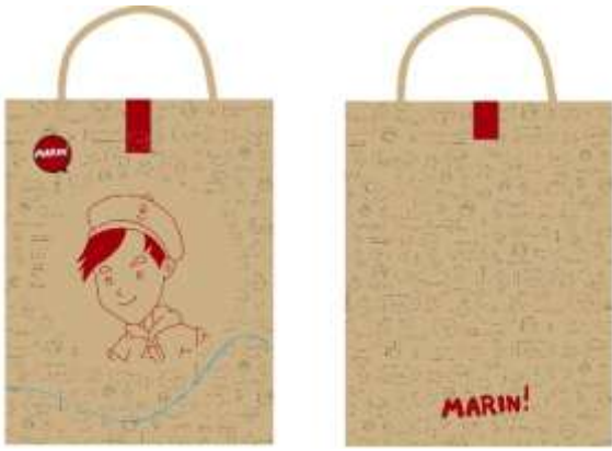
Gambar 18. Packaging 2