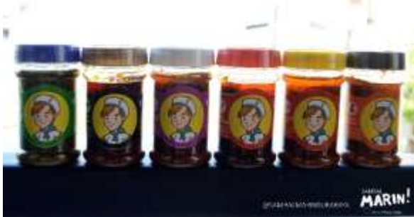
Gambar 1. Produk Sambal Marin

Surabaya” dapat bersaing dengan produk-produk sambal lainnya yang sudah dikenal oleh masyarakat Surabaya, serta mengalami kenaikan penjualan. Dengan adanya perancangan media promosi ini diharapkan dapat memperluas penjualan, sehingga jumlah penjualan semakin meningkat.