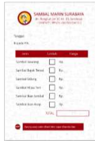
Gambar 15. Nota Penjualan