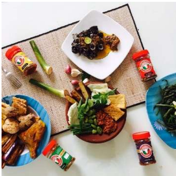
Gambar 5. Produk Sambal Rowena