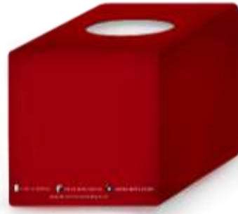
Gambar 22. Kotak Tissue