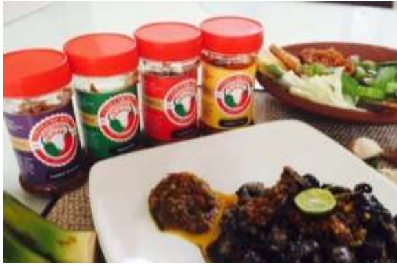
Gambar 4. Produk Sambal Rowena