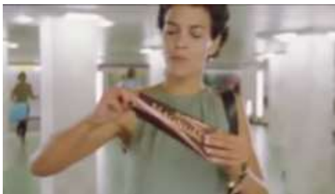
Gambar 1. Figur perempuan

Iklan yang akan diteliti adalah iklan Es Krim Magnum yang berjudul "Magnum Classic". Pada iklan tersebut digambarkan seorang figur perempuan yang sedang berangkat ke kantor menggunakan kereta api bawah tanah. Sebelum masuk ke dalam kereta, perempuan tersebut menikmati sebatang es krim Magnum, tiba-tiba ada beberapa pelayan yang memperlakukan perempuan tersebut bak seorang ratu kerajaan. Para pelayan tersebut mengikuti kemanapun perempuan itu pergi, bahkan hingga ke dalam kantor. Sepulang dari kantor, perempuan tersebut digambarkan pulang dengan menggunakan kereta kerajaan. Perempuan ini terlihat sangat bahagia, ia menjadi tontonan dan perhatian banyak orang. Ketika tiba di kamar apartemennya, perempuan ini terkaget mendengar suara riuh di luar. Ia langsung bergegas berlari ke balkon apartemennya. Ternyata ada begitu banyak orang menunggu kehadirannya. Wanita itu terlihat kaget dan bahagia karena diperlakukan bak ratu kerajaan.