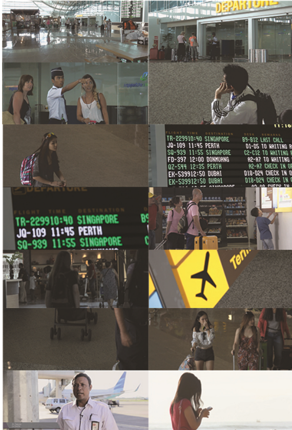
Gambar 2. Final Video (2)