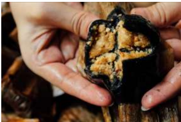
Gambar 15. Kue Lompong

Kue Lompong adalah kue yang terbuat dari adonan tepung ketan dan londo oman (gagang padi) sebagai pewarna hitam alami. Isi dari kue lompong adalah kacang tumbuk yang disangreh dan diberi gula pasir. Makanan khas Kutoarjo ini biasanya dijadikan sebagai camilan ataupun oleh-oleh dan dapat dipesan terlebih dahulu karena Kue Lompong tidak tahan lama sehingga hanya dibuat sesuai orderan saja. Kue Lompong memiliki tekstur yang kenyal dan manis yang berasal dari isian kacang tumbuknya, sehingga