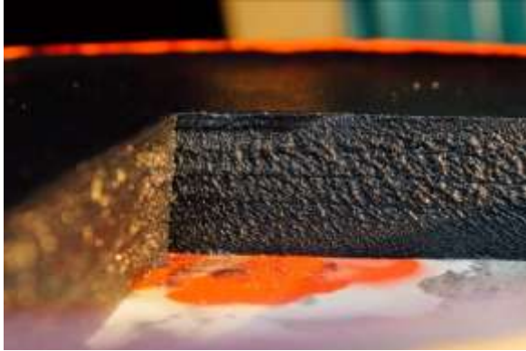
Gambar 14. Jongkong Wulan Sari

Buka setiap hari (pemesanan via telepon minimal sehari sebelumnya)