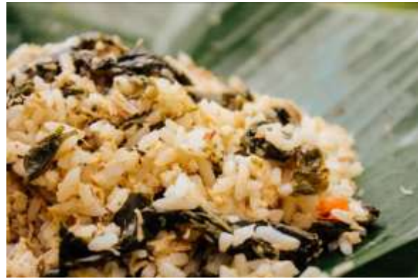
Gambar 8. Sego Megono