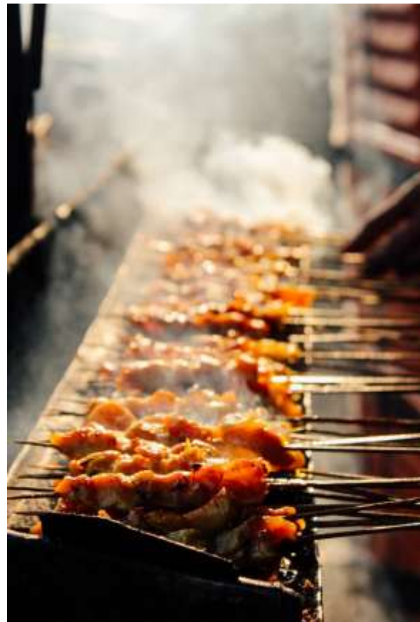
Gambar 6. Sate Ambal

Perbedaan Sate Ambal dengan sate ayam lainnya adalah penggunaan sambel tempe sebagai bumbu sate, bukan bumbu kacang sebagaimana sate ayam lainnya, selain itu bumbu sambel tempe lebih cair daripada