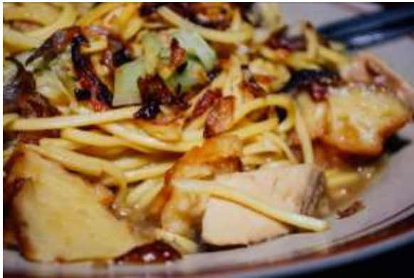
Gambar 4. Mie Jowo

Ciri khas dari Mie Jowo ini adalah penggunaan kekian dan cara masaknya yang masih sangat tradisional, yaitu menggunakan anglo yang dikipasi secara manual menggunakan tangan yang menyebabkan Mie Jowo memiliki aroma asap yang khas. Buka mulai pukul 17.00, Mie Jowo ini sangat cocok dinikmati sebagai menu makan malam bersama keluarga.