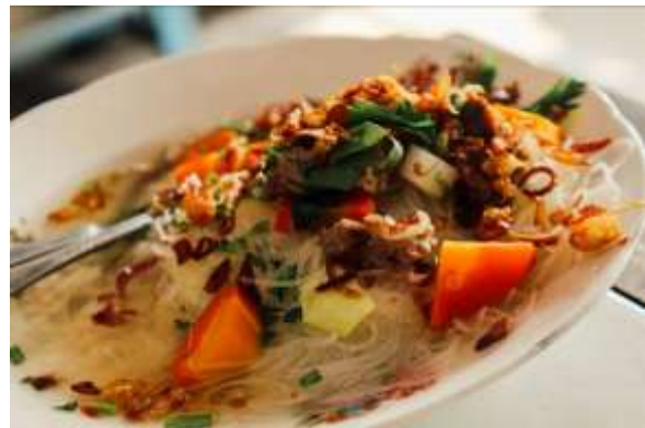
Gambar 9. Sop Pak Giyo