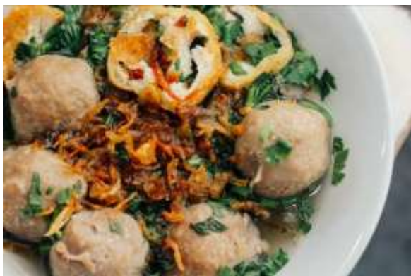
Gambar 1. Bakso Mas Sandy

Berdiri sejak tahun 1985, bakso ini terkenal karena daging baksonya yang empuk dan kuahnya yang bening serta terbuat dari kaldu sapi hasil olahan