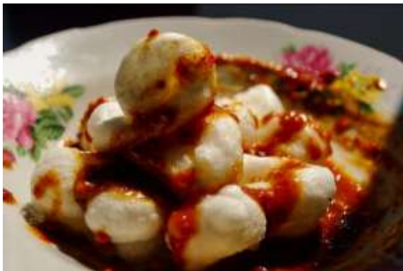
Gambar 11. Geblek Bumbu

Geblek Bumbu dibuat dari tepung singkong dan dipilin berbentuk cincin, yang kemudian digoreng dan disajikan dengan bumbu pecel. Unik dan gurih!