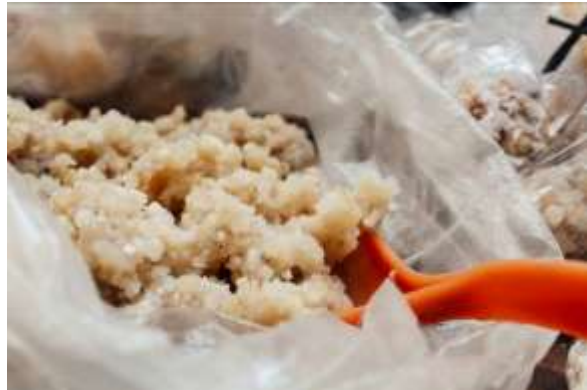
Gambar 12. Growol

Makanan mirip nasi dari bahan dasar gapek (ketela yang dikeringkan), Growol dimakan sebagian warga kalangan atas yang tengah menjalani diet dan juga dikonsumsi oleh mereka yang menderita sakit diabetes melitus atau penyakit gula.