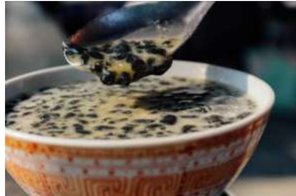
Gambar 16. Dawet Ireng

Dawet berwarna hitam yang berbahan dasar sagu dan abu merang yang diberi kuah santan, gula jawa, dan es batu yang sudah dihancurkan menjadi serpihan-serpihan kecil. Disajikan selagi dingin, Dawet ireng ini sangat digemari masyarakat sekitar untuk dikonsumsi pada siang hari.