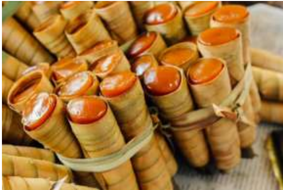
Gambar 10. Clorot

Makanan khas Grabag yang terbuat dari tepung beras, kanji dan gula merah yang dimasak dan dipilin menggunakan daun kelapa. Teksturnya yang kenyal dan manis menjadikan clorot sangat digemari masyarakat untuk dikonsumsi sebagai camilan