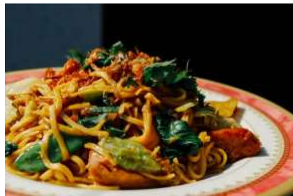
Gambar 3. Mie Goreng Kekian

Mie Goreng Kekian merupakan menu favorit di rumah makan ini, hal ini karena penggunaan kekian yang merupakan hasil olahan sendiri yang menjadikan