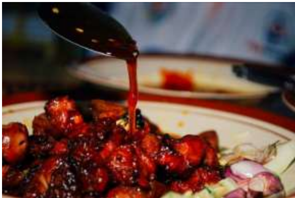
Gambar 7. Sate Winong

Ciri khas dari Sate Winong adalah bumbu satanya yang menggunakan kecap asli buatan sendiri dan daging sate yang sudah dilepas dari batang sate dan dimakan langsung di atas piring. Bumbu dari Sate Winong memiliki tekstur cair dan agak pedas, dilengkapi dengan irisan bawang merah dan cabai. Keunikan dari Sate Winong ini adalah bumbu dan sate dipisah, sehingga konsumen dapat mencampurkan sendiri bumbu ke dalam sate sesuai selera masing-masing.