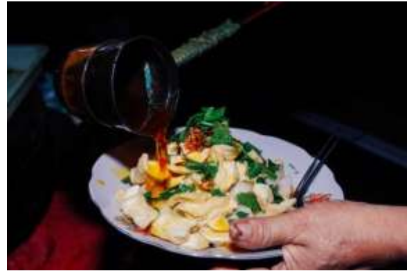
Gambar 2. Kupat Tahu Peturunan

Menggunakan resep keluarga sejak tahun 1989, Kupat Tahu Peturunan sangat terkenal di kalangan masyarakat Kutoarjo. Kupat tahu ini merupakan salah satu menu terfavorit warga di kala jam makan siang.