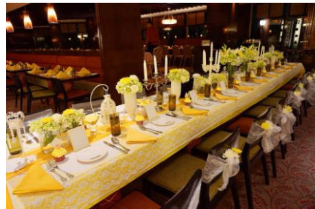
Gambar 4. Dekorasi Meja

Potensi Elite Party Designer adalah sebuah jasa dekorasi yang dapat membuat suatu acara menjadi lebih berkesan dan tidak terlupakan dengan memberikan nuansa yang elegant pada dekorasinya yang selalu berkolaborasi dengan berbagai macam bunga yang akan di sesuaikan dengan tema yang di ajukan