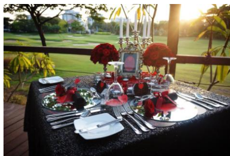
Gambar 5. Dekorasi Meja