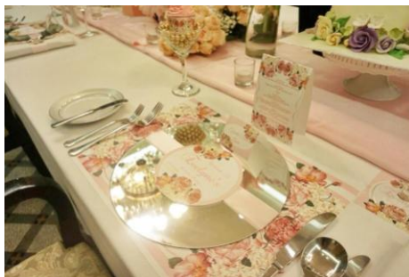
Gambar 6. Dekorasi Meja

Secara visual gaya dekorasi yang di gunakan Elite Party Designer adalah gaya dekorasi klasik modern, dapat di lihat setiap dekorasi yang di buat dengan konsep minimalis tetapi selalu menggunakan unsur bunga di dalamnya agar tetap memiliki unsur anggun dan mewah. Unsur warna yang di gunakan dalam setiap dekorasi mengikuti tema dan keinginan klien, tapi kecenderungan warna yang sering di gunakan adalah warna – warna yang terlihat soft karena terlihat lebih tenang dan feminim.