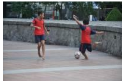
Gambar 4.24 Bermain futsal di taman kota (1)