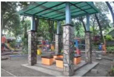
Gambar 2.4 Gazebo dan playgroup