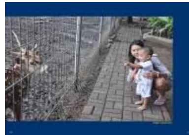
Gambar 4.54 Layout katalog halaman 23 & 24