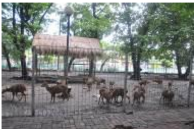
Gambar 2.6 Fauna