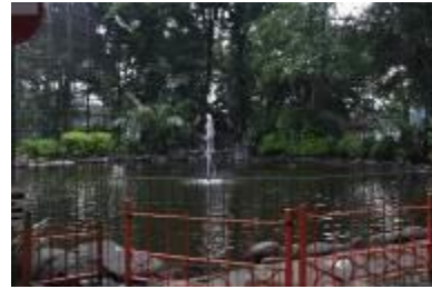
Gambar 2.7 Kolam ikan