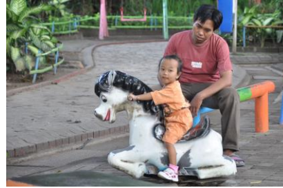
Gambar 4.22 Menunggang kuda ditemani ayah (1)