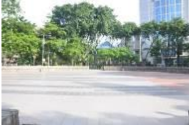
Gambar 2.2 Lapangan open space