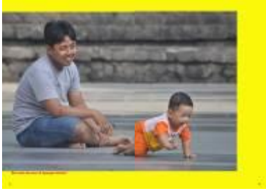
Gambar 4.45 Layout katalog halaman 5 & 6