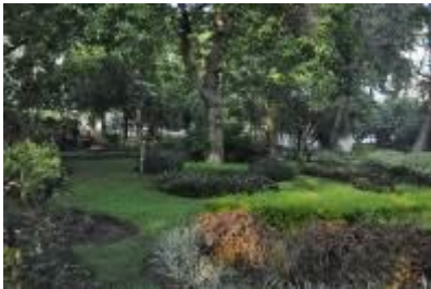
Gambar 2.14 Taman Persahabatan