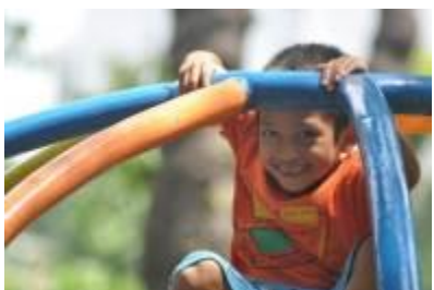
Gambar 4.39 Ayo bermain bersama (1)