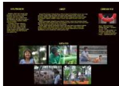
Gambar 4.42 Layout katalog pameran bagian dalam