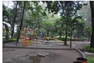
Gambar 2.8 Arena bermain anak