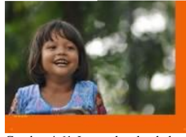
Gambar 4.61 Layout katalog halaman 37 & 38