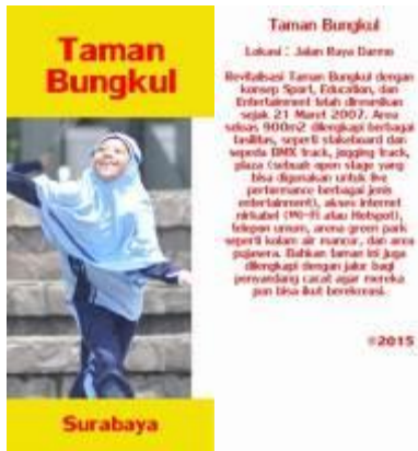
Gambar 4.65 Layout pembatas buku 1 depan dan belakang