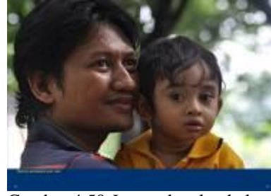
Gambar 4.50 Layout katalog halaman 15 & 16