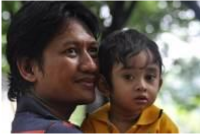
Gambar 4.28 Menonton pertunjukkan anak-anak (1)