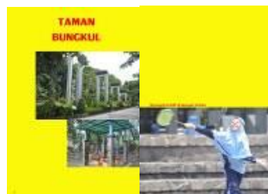
Gambar 4.43 Layout katalog halaman 1 & 2