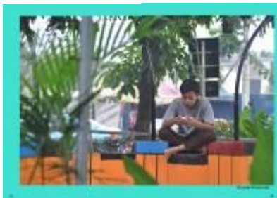
Gambar 4.56 Layout katalog halaman 27 & 28