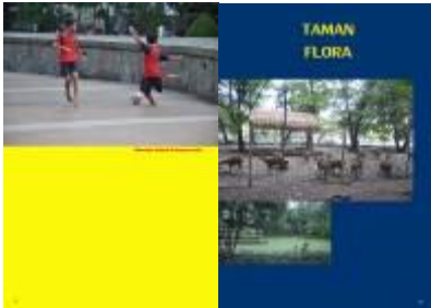
Gambar 4.46 Layout katalog halaman 7 & 8