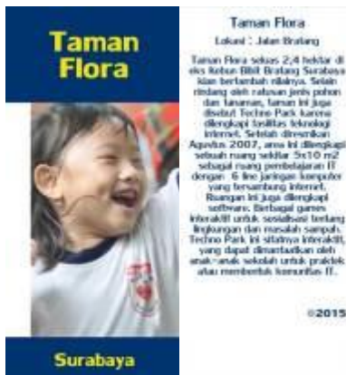
Gambar 4.66 Layout pembatas buku 2 depan dan belakang