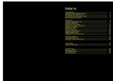
Gambar 4.63 Layout isi katalog awal 1 & 2