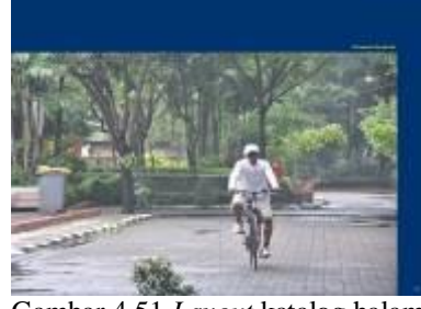
Gambar 4.51 Layout katalog halaman 17 & 18