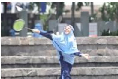
Gambar 4.21 Semangat berlatih di lapangan terbuka (1)