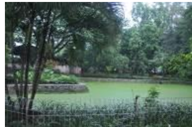
Gambar 2.10 Danau buatan