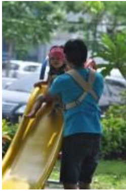
Gambar 4.36 Bersenang-senang di taman kota (1)