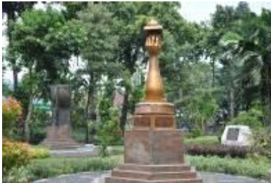
Gambar 2.24 Replica penghargaan