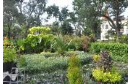
Gambar 2.18 Taman Lansia