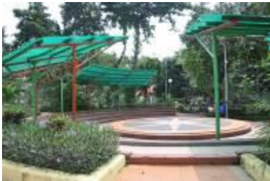
Gambar 2.23 Panggung terbuka