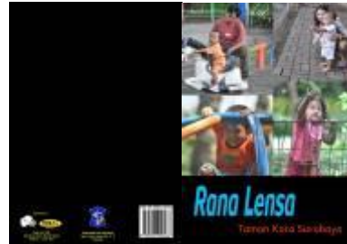
Gambar 4.62 Layout cover katalog depan dan belakang