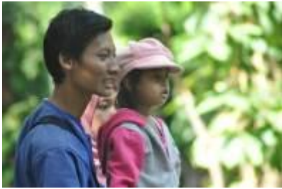
Gambar 4.27 Rekreasi keluarga (1)