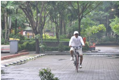
Gambar 4.29 Bersepeda di pagi hari (1)