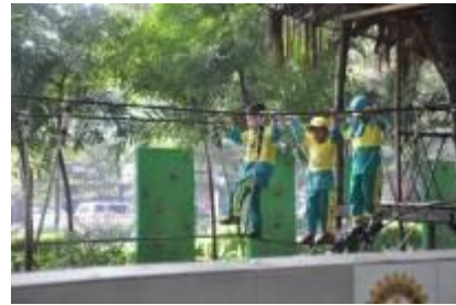
Gambar 4.32 Rombongan Sekolah Dasar (1)