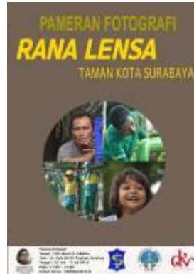
Gambar 4.41 Poster pameran