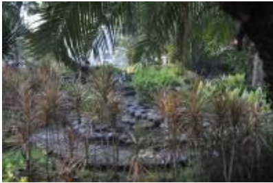
Gambar 2.13 Kolam air mancur