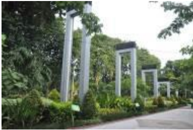
Gambar 2.3 Pedestrian