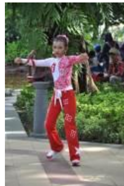
Gambar 4.34 Pertunjukkan senam di taman kota (1)