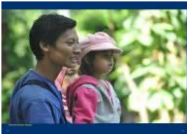
Gambar 4.49 Layout katalog halaman 13 & 14