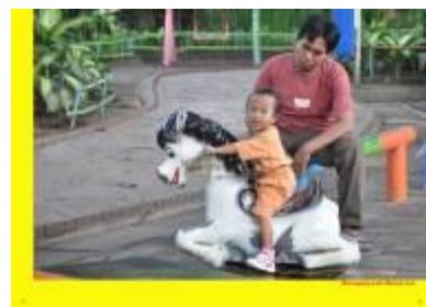
Gambar 4.44 Layout katalog halaman 3 & 4