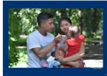
Gambar 4.52 Layout katalog halaman 19 & 20