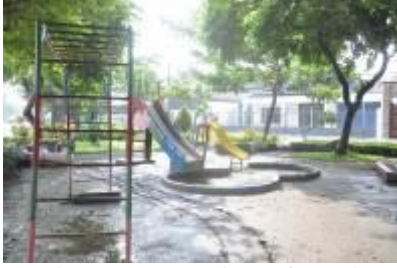
Gambar 2.12 Arena bermain anak (2)