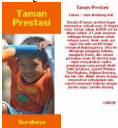
Gambar 4.67 Layout pembatas buku 3 depan dan belakang