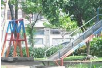
Gambar 2.15 Area bermain anak