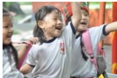
Gambar 4.25 Semangat menggapai cita-cita (1)