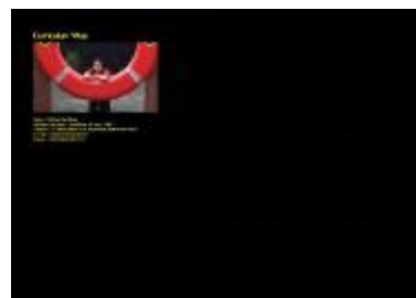
Gambar 4.64 Layout isi katalog akhir 1 & 2