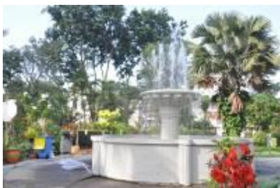
Gambar 2.16 Air mancur