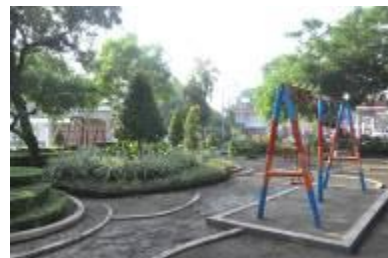
Gambar 2.11 Arena bermain anak (1)