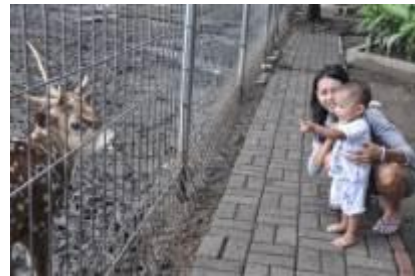
Gambar 4.33 Belajar tentang fauna (1)