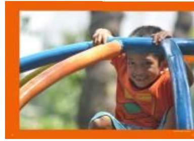
Gambar 4.60 Layout katalog halaman 35 & 36