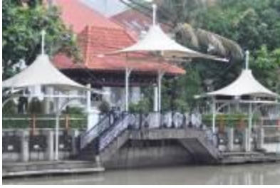
Gambar 2.22 Kalimas