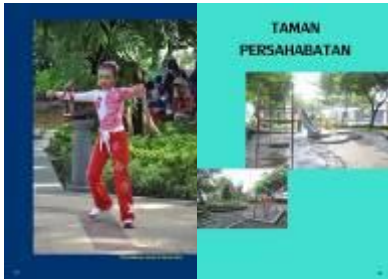
Gambar 4.55 Layout katalog halaman 25 & 26