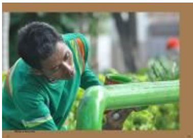
Gambar 4.58 Layout katalog halaman 31 & 32