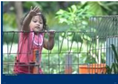
Gambar 4.48 Layout katalog halaman 11 & 12