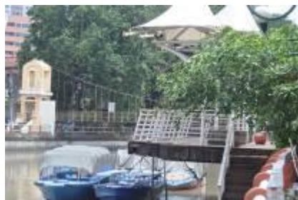
Gambar 2.21 Perahu dayung