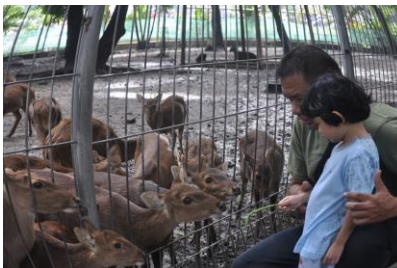
Gambar 4.31 Bermain dengan fauna (1)