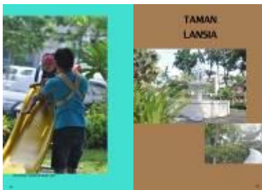
Gambar 4.57 Layout katalog halaman 29 & 30