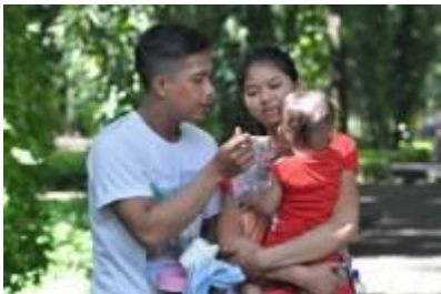
Gambar 4.30 Keluarga harmonis (1)