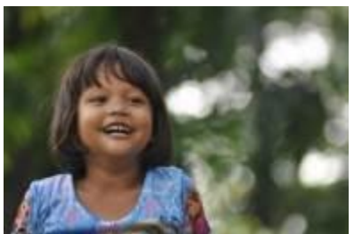
Gambar 4.40 Hati yang gembira (1)