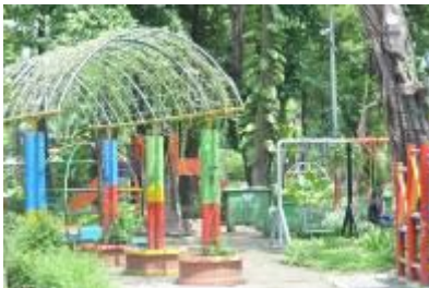
Gambar 2.25 Taman bermain anak (2)