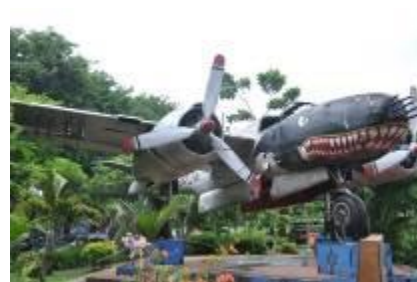
Gambar 2.19 Monumen pesawat bomber