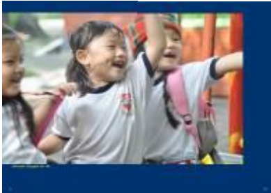
Gambar 4.47 Layout katalog halaman 9 & 10