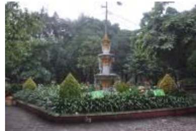
Gambar 2.9 Air mancur