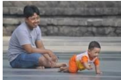
Gambar 4.23 Bercanda bersama di lapangan terbuka (1)