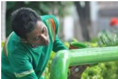
Gambar 4.37 Bekerja di taman kota (1)