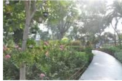
Gambar 2.17 Jogging track