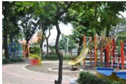
Gambar 2.20 Taman bermain anak (1)