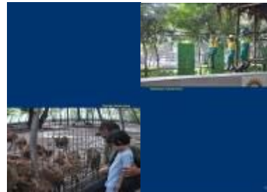
Gambar 4.53 Layout katalog halaman 21 & 22