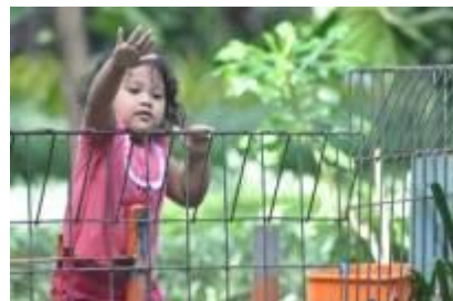
Gambar 4.26 Bermain di kolam ikan (1)