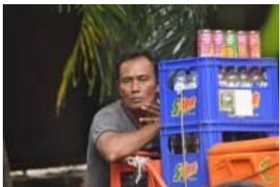
Gambar 4.38 Menunggu pembeli (1)