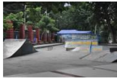
Gambar 2.5 Lapangan skateboard