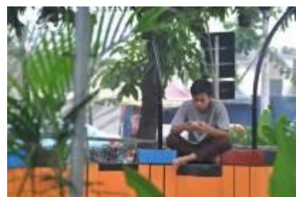
Gambar 4.35 Bersantai di taman kota (1)