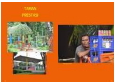
Gambar 4.59 Layout katalog halaman 33 & 34