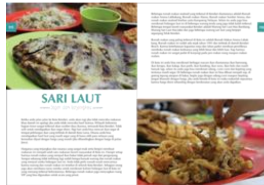
Gambar 9. Isi buku 6