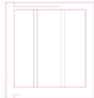
Gambar 2. Coloumn Grid