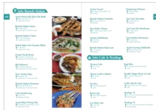
Gambar 10. Isi buku 7