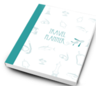
Gambar 12. Travel Planner