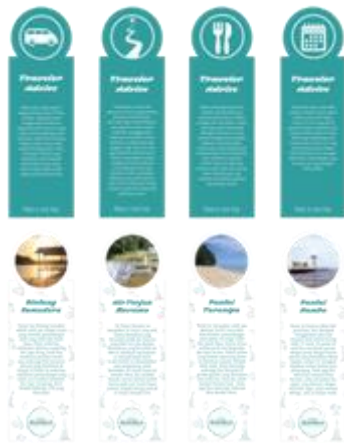
Gambar 13. Pembatas buku