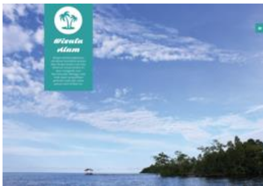
Gambar 6. Isi buku 3