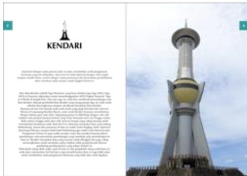
Gambar 5. Isi buku 2