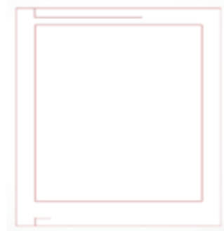
Gambar 1. Manuscript Grid

Layout buku akan menggunakan perpaduan antara dua grid , yaitu manuscript grid dan coloumn grid . Hal ini dilakukan untuk mengatur kombinasi layout dari teks, foto maupun ilustrasi. Tema layoutnya simple dan tidak memakai ornamen-ornamen yang berlebihan agar terkesan lebih elegan, ini juga disesuaikan dengan target audience yang berasal dari kalangan menengah dan menengah keatas. Layoutnya juga memanfaatkan white space agar tidak terkesan padat dan pembaca menjadi lebih santai dalam membaca buku panduan ini.