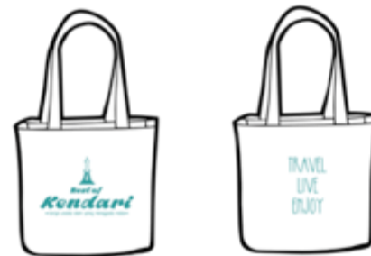
Gambar 15. Tote bag