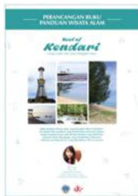
Gambar 18. Poster Pameran