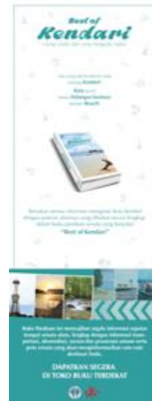
Gambar 19. X-banner