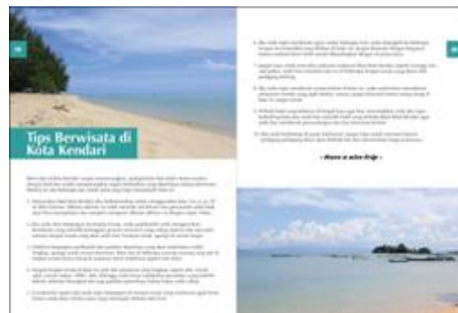
Gambar 4. Isi buku 1