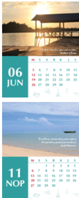
Gambar 16. Kalender