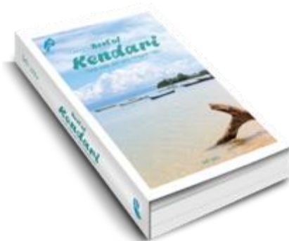
Gambar 3. Cover buku