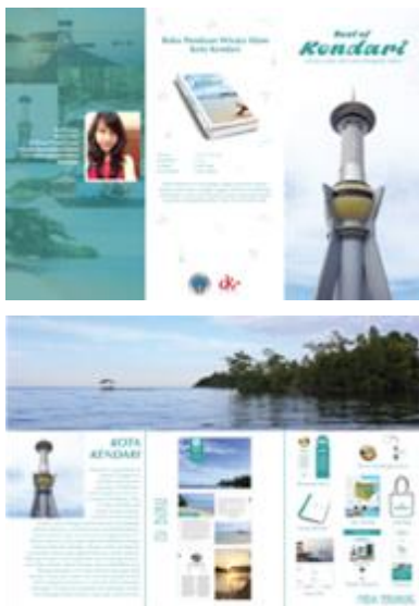
Gambar 17. Katalog