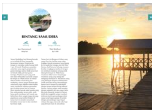
Gambar 7. Isi buku 4