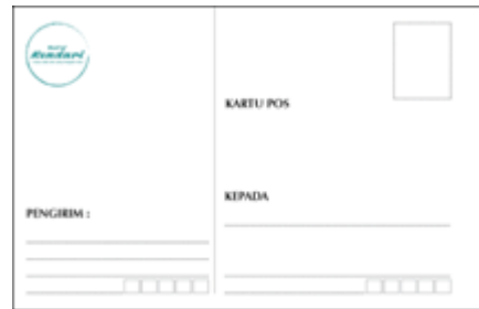
Gambar 14. Kartu pos